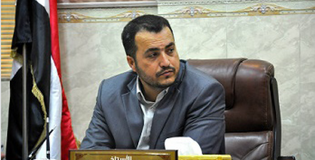
وزير الاعمار والاسكان والبلديات والاشغال العامة طارق الحكيتاني

وقال الوزير ان نسبة اجاز المشروع بلغت 58 % وبكلفة (13) مليار دينار حيث ينفذ المشروع لصالح وزارة الاتصالات . وذكر ان بنى خفية في بعض احياء طوابق وسرداب وبرج اتصالات فوق البناية بارتفاع (46) م ويجري العمل حاليا في اعمال القالب الخنثسي وحديد التسليح والاعمدة للطابق الرابع ويشتمل العمل ايضا الاعمال الكهربائية والصحية والميكانيكية