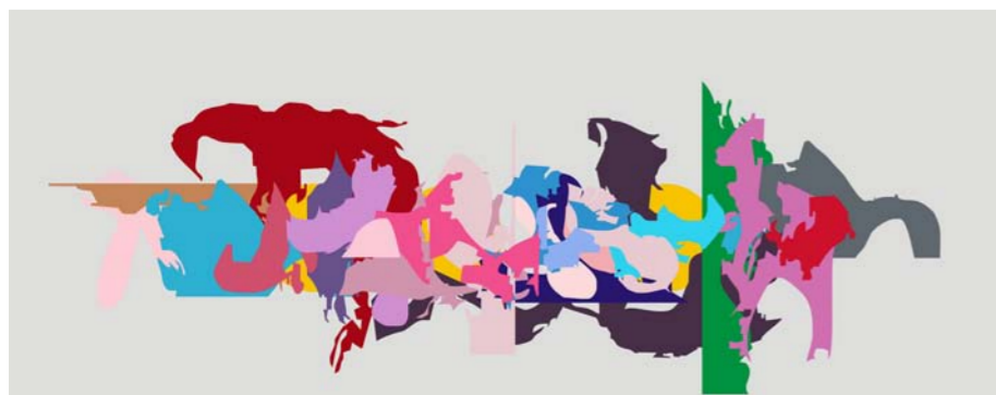
لوحة للفنان الراحل احمد الربيعي

في وجه الشمس من كلمات حياة أو وداع هناك يظهر ملك وفي يديه عملة الربع الخالي بنك حياتك الأبدية.