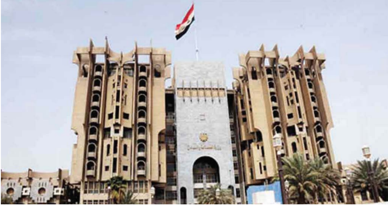
واجهة مبنى وزارة الصناعة والمعادن

مطابقتها مع المحددات البيئية المطلوبة حيث تم إرسال النماذج الى مديرية بيئة بابل للفحص . ولفت مدير عام الشركة الى انه من اجل ضمان بيئة خالية من الروائح والملوثات الصناعية نتيجة للتوسع العمراني في المنطقة القريبة من المصنع لجأت الشركة لتنفيذ هذا المشروع للاسهم في خلق بيئة صناعية سليمة للمواطن العراقي ضمن الموقع الجغرافي للمصنع .