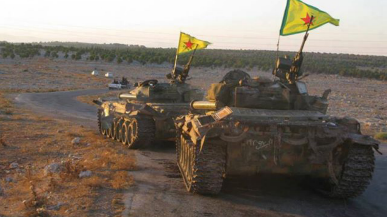
قوات حماية الشعب

وأضاف أنه يتعين على روسيا والولايات المتحدة وأوروبا تشجيع الحوار السياسي بين أطراف الصراع في سوريا. وأشار بوتين إلى أن تركيا أحد أهم شركاء روسيا وأن موسكو بحاجة إلى فهم سبل بناء علاقات مع تركيا تحاربة الإرهاب. وأضاف أن الأهداف كانت في الرقة وحماة وادلب واللاذقية وحلب التي ذلك نقلت وكالة الاعلام الروسية. امس الثلاثاء عن وزير الخارجية الروسي سيرجي لافروف قوله إن روسيا تعتقد أن جزءا كبيرا من إمدادات السلاح الأمريكية للمعارضة السورية يقع في أيدي جماعات إرهابية.