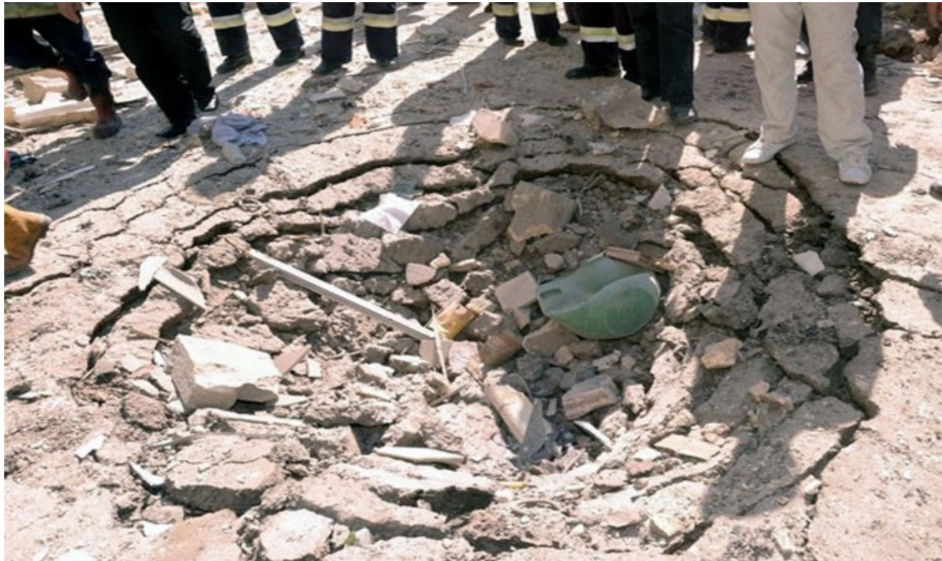
آثار عبوة ناسفة فجرها داعش في ديالى

واسعة للاعمار والحكومة المحلية لديها خطط متكاملة من أجل البدء بها لكنها تنتظر الدعم المالي من الحكومة المركزية للانطلاق. واقر التميمي بان «منظومة الطرقات البرية في ديالى تعرضت الى ضرر بالغ خاصة استهداف الجسور والمعابر لكنه عبر عن تفاؤله باعمارها في الفترة الحكومية المحلية بالتنسيق مع الدوائر ذات العلاقة».