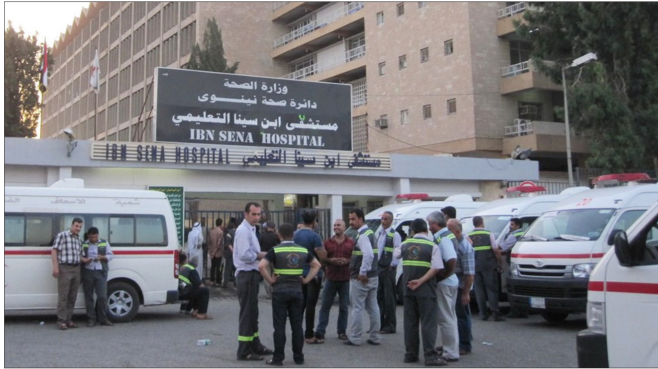
احدى مستشفيات الموصل