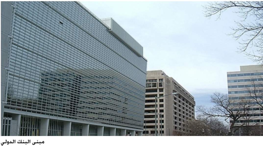
مبنى البنك الدولي

ورفض أيضاً ناطق باسم المفوضية الأوروبية هذا التقرير، قائلاً ان «مثل هذا الاقتراح غير مطروح حالياً وليس قيد البحث». مشيراً إلى ان المفوضية «لا تعلق على الشائعات في الصحف». وكانت صحيفة «سودويتشه تسايتونج» الألمانية