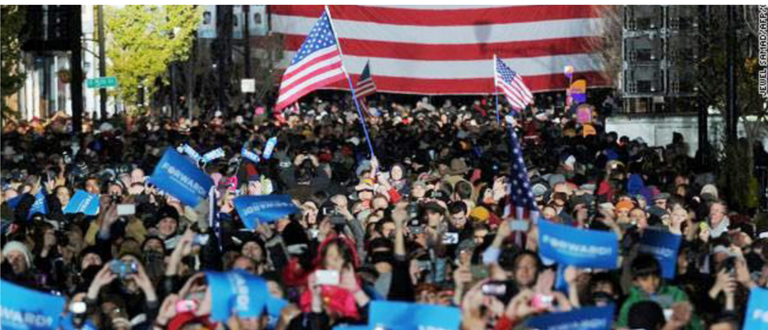
احدى الحملات الانتخابية في أميركا

ويرتبط عدد من الأسر بشبكات من الجهات المانحة الأيديولوجية. سواء كانوا من اليسار أو اليمين. من بينهم دوغ دياسون وزوجته. ورائد الوساطة العقارية تشارلز شواب وزوجته هيلين. ومن بين الجهات المانحة أيضا. شركة الضخمة في شيكاغو. خصوصا إذا عرفنا أنه يكسب شهريا 68 مليونا و500 ألف دولار. وفي منطحات قضائية أدلت بها زوجته من دعوى طلاقها. لكن غريفيث 300 ألف دولار فقط لجماعات دعم