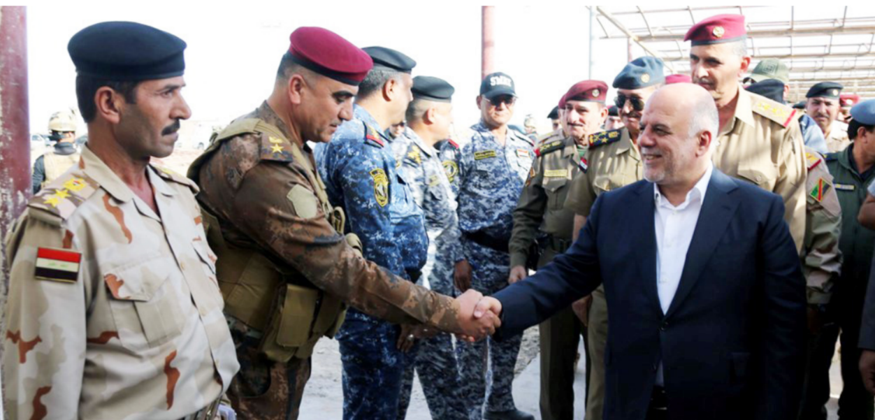
العبداء يزور صلاح الدين قبل بدء العمليات

وفي هذه الأثناء، أفاد مصدر أمني في قيادة عمليات صلاح الدين بتصريح لـ "الصباح الجديد" أن "مدفعية الجيش العراقي تواصل قصفها لمعاقل تنظيم داعش داخل ناحية الصينية غربي بيجي". تتمتع 3ص