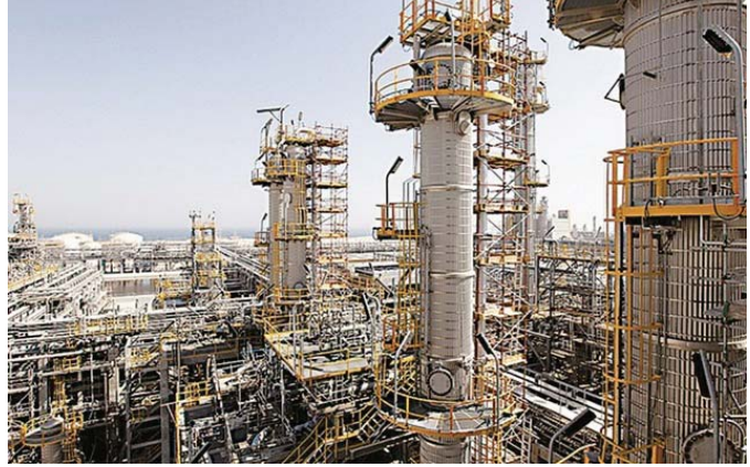
مصنع للبتروكيمياويات في البصرة

يعود بتحديد خطوط الإنتاج وتوسيع القاموس الكيماوية واحدة من الاستثمار وأغراض السوق منتجات بديسة. ولعل هذا الأمر يشمل فصرات المنطقة التصنيعية التي تازم حاجة الأسواق المحلية وزارة التجارة على شراء البترول من الشركة العامة للبترول النافثة. وكذلك الحال لوزارات الداخلية والدفاع في جبهتها باللائح والصناعات الجديدة من شركات وزارة التجارة والاعتماد على شركات النفط التي تعزل تنديتها، متفقا انه «بعد تنفيذ المادة 28 من الاتفاقية الاقتصادية الجديدة مع الشركات العالمية».