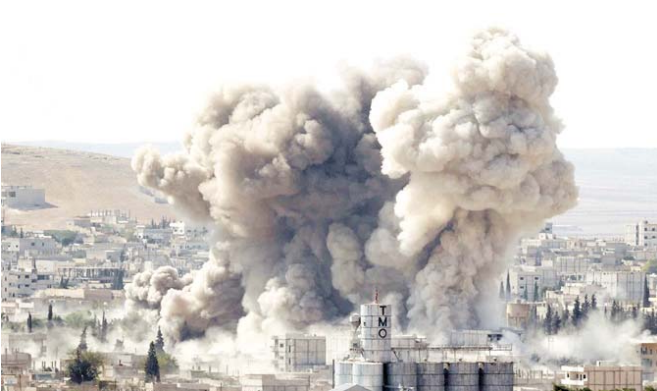
قصف التحالف في صنعاء

يقتل المدنيين من خلال ما وصفوه بالمشنقات جارات جوية مكثفة وبمبارزين على مدار ساعات ممتدة وبمبارزين على مدار ساعات المركة الجوية وأتلس جلفهم على عدد الله صالح المستهدفة بالغايات الجوية خالصة لتمام من السكان ولا حدود من قصفها على حد تعبيرهم. وفي تطور منفصل، اتهمت السلطات السعودية الحوثيين باعتقال اثنين من جودها داخل اليمن.