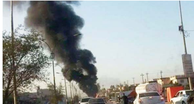
ضربة جوية التحالف على داعش في الموصل

أعلى قرار الحكومة العراقية الذي صدر في مطلع شهر آب الماضي يوقف تسليم رواتب الموظفين في المناطق الخاصة بسيطرة تنظيم داعش الارهابي بمحافظة نينوى نتائجها اولى، برغم الأذى الذي أصاب الآلاف العائلات التي لا مصدر دخل لها سوى تلك الرواتب