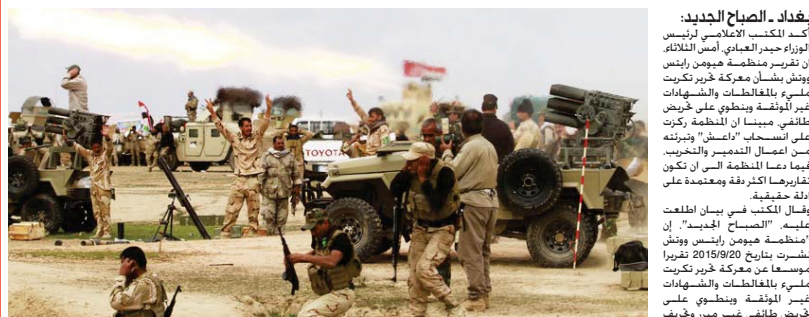
القوات الأمنية والحشد الشعبي في معركة خريب تكريت "أرشيف" - وقال المكتب في بيان أطلعت عليه "الصباح الجديد" إن منظمة هيومن رايتس ووتش نشرت بتاريخ 2015/9/20 تقريراً موسعاً عن معركة خريب تكريت...