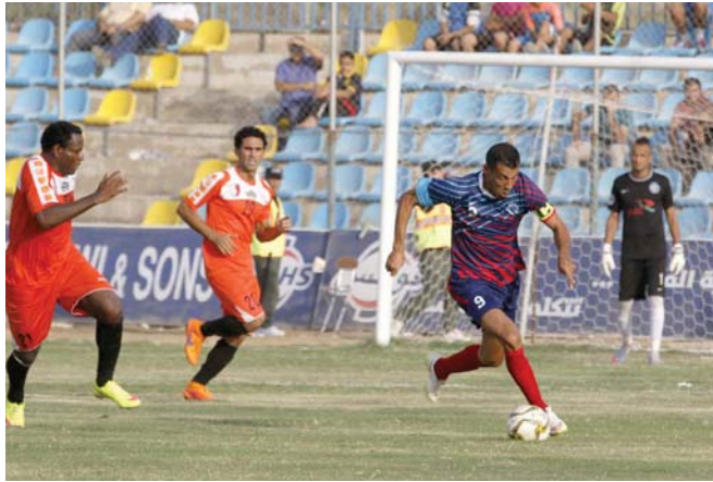
جانب من مباراة الطيبة والكهرباء في الموري الممتاز "عمسة: محمد عامر"