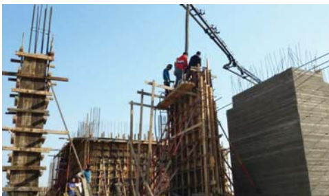
جانب من اعمال المنصور

بغداد - طارق كريم: تواصل شركة المنصور العامة للعمليات الانشائية احصي تشكبات وزارة الاعمار والاسكان والبلديات العامة العمل لاچار مشروع المركز الثقافي في الكاظمية في بغداد. ويتضمن مبنى المركز اعصمة وسحورا وسقفها كونكريتية والبنية متعدة الطوائف مكونة من سرادب وطابق ارضي ولاتاة طرقات متكررة وهي مصممة لتسوية على قطعة ارض باعاء(330-20)م. وتشتمل السرادب الذي يحتوي على غرفة صينية وغرف صيانة الخدمات الكهربائية والميكانيكية والصحية . اما الطابق الارضي يحتوي على المدخل الرئيسي للبنية اضافة الى مدخل خدمة مع وجود قاعة متعددة الاغراض . فيما يحتوي الطابق الاول على المعرض وقاعات التدريب وكافتيريا