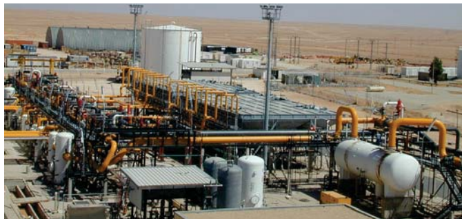
أحد الحقول النفطية في البلاد

قوله «بالتشاور مع وزارة البترول تمت مناقشة ثلاثة خيارات للأسعار هي 42 و 45 و 50 دولاراً من المتوقع أن خسر 68 تريليون تومان (حوالي 22.5 مليار دولار)» وشراخ حجة شاول خامنوسن القيادي بين 42 و 55 دولاراً للبرميل في الشهر الأخير ونزل إلى أقل من 48 دولاراً صباح أمس. ودعت إيران العضو منظمة البلدان المصدرة للبترول (أوبك) والتي تعتمد على مبيعات الخام لإحداث توازن في موازنتها المتحسين الآخرين إلى خفض الصادرات لدعم الأسعار بينما توقع أن يزيد هي إنتاجها في 2016 حصة من المنتظر رفع العقوبات المفروضة عليها بسبب برنامجها النووي في ذلك الوقت، وتتوقع إيران أيضاً أن حصل على نحو 100 مليار دولار من الأرصدة المحبذة وذلك في إطار الاتفاق النووي الذي توصلت إليه في تموز مع القوى الدولية. وقال رويخت «بالرغم من أن الأسعار أصبحت ثابتة مثل إنهاء الأضرار المالية التي سببها إنهاء خصمها من الممكن أن تزداد القوة الشرائية للأفراد».