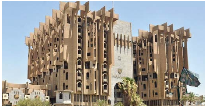
وزارة الصناعة والمعادن

تقوم شركة المنصور منذ ما يقرب من الاربعة عقود من الز من تجهيز المستشفيات بالاوكسجين الطبي الخاص بالحالات الانسانية والمرضية والطارئة بحاليته السائلة والغازية