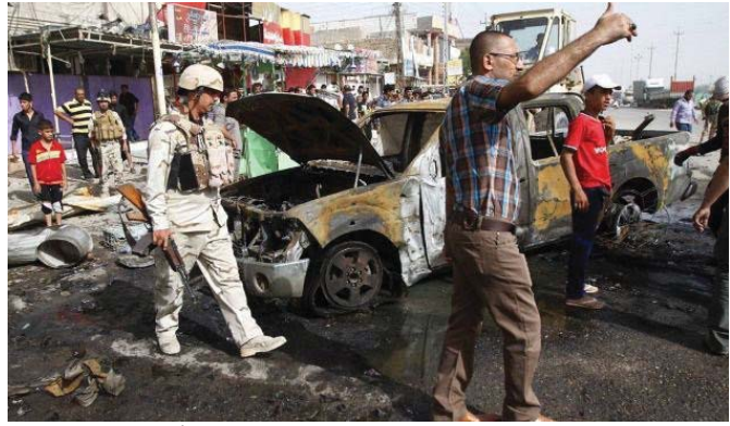
أحد التفجيرات الإرهابية في ديالى