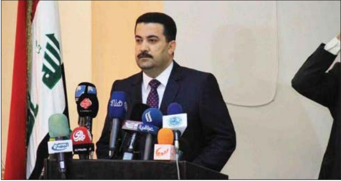
وزير العمل والشؤون الاجتماعية

بغداد - الصباح الجديد: اعلنت وزارة العمل والشؤون الاجتماعية فتح التسجيل على القروض الصغيرة للمرة للدخل عن طريق وصلها الالكتروني لمحافظات الانبار وصلاح الدين وبنين وكركوك والبصرة وذي قار لعدة شهر. وقال المتحدث باسم الوزارة عماد منعم ان الوزارة باشرت باطلاق القروض للصغار من محافظات الانبار وصلاح الدين ونينوى من المناطق التي تخضع للسيطرة الحكومية على القروض الصغيرة لمحافظات كركوك وذي قار والبصرة كونها استنفدت حصصها من صندوق الاقراض وسيتم تقديم عليها عن طريق الموقع الالكتروني لوزارة. و اضاف ان عملية التسجيل على القروض ستستمر مدة شهرين من 9/13 لغاية 10/13 على ان يكون المشروع يقع ضمن المناطق التي تخضع لسيادة الدولة بالنسبة لمحافظات الانبار وصلاح الدين ونينوى.