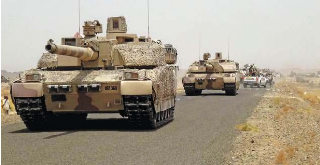
ممرعات تابعة للتحالف العربي

على تنفيذ متطلبات القرار الدولي كتنفيذ وقف إطلاق النار وضبط الوضع الأمني في العاصمة، وتسليم السلاح والإشراف على انسحاب معظم شكل الجماعات المسلحة من المناطق الأخرى عن العقوليين للشوطين بالقرار الدولي، ويصرف النظر عن إصدار الحكومة الشرعية على أن توليها هي بنفسها تنفيذ ذلك الأمر سواء في خلال اتفاق تسوية أم عبر فرض حل بالفضة وإصدار الحوثيين لصالح على مبدأ التسوية أم تطبيق القرار الأممي فإن ثمة عقبات أخرى أمام أي حل يستند إلى بنود ذلك القرار.