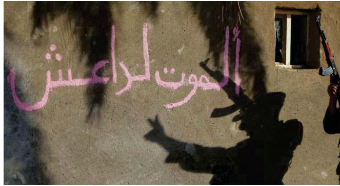
شعارات منقوشة على جدران شوارع الموصل

مجهولون في مدينة الموصل باتوا يعتقدون اساليب جديدة بتخمين من خلالها تنظيم داعش الإرهابي يهزون صورته امام الاهل من خلال كتابة شعارات على الجدران العامة والخاصة، تتحداه وتؤكد ان التنظيم يفقد سيطرته على المدينة ليلا