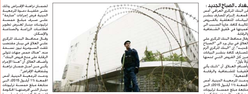
البنك المركزي "رشيف"

بغداد - الصباح الجديد: قرر البنك المركزي العراقي أمس العمل على تعزيز الشفافية في البيانات المتعلقة بالقروض المالية كافة عابراً السبب إلى أهميتها في تحقيق الشفافية والرقابة. وقال محافظ البنك المركزي على العراق في بيان وزر إلى "الصباح الجديد" إن "البنك المركزي أزم المصارف كافة بنشر البيانات عن كل القروض التي تمنحها أولاً بأول". وأضاف العلال أن "تلك باتي خفياً للشفافية والرقابة المجتمعية". ودمت الرجعية المدنية، أمس الجمعة (11 أيلول 2015)، مصادقة مبلغ خمسة ترليون دينار العراقي، إرضتها الحكومة للبنك المركزي بموجب "مؤقتة" على ضرورة "إتباع الإجراءات صارت" في صرف تلك المبالغ إلى المصارف الزراعية والصناعية وصندوق الإسكان.