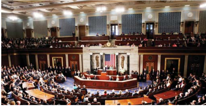
مجلس الشيوخ الأمريكي يوافق على تمرير الاتفاق النووي

بنيامين نتنياهو وبنجاحه الاتفاق بشدة. ويقول إنه لن يبيع إيران من السعي للحصول على أسلحة نووية يمكن استخدامها لاستهداف إسرائيل. وينقسم جمعيت اليهودي بشأن الاتفاق حيث يؤيده مجموعة «حماي سترتير» التقدمية بينما تعارضه اللجنة اليهودية الأمريكية وكذلك لجنة الشؤون العامة الأمريكية الإسرائيلية (أيباك) التي تتمتع بنفوذ وورد أنها تنفق أكثر من 20 مليون دولار على حملة معارضة الاتفاق. وبين المحاصرات الموقعية على