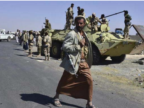
العراك في اليمن أدت إلى مقتل 4500 مواطن

البحث في تطبيق قرار مجلس الأمن الدولي رقم 2216 الذي ينص على انسحاب المتمردين الحوثيين وخلفاتهم للوالين للرئيس السابق علي عبد الله صالح من المدن والأراضي التي سيطروا عليها منذ العام الماضي. وقال البيان إن المشاركين في الاجتماع بين فيهم بالمسحاب السياسي للرئيس هادي قروا الموافقة على حضور المفاوضات الإيمانية إلى تنفيذ قرار مجلس الأمن الدولي رقم 2216 للعام 2015.