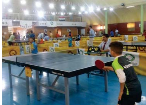
من منافسات البطولة "عمسة" الصباح الجديد

ويشارك في بطولة فتي مجموعيات صمت اندية وزعت بين مجموعيات صمت الأولى اندية الصناعات وجمعية الشطرنج وديالى الاميني والثانية تكونت من الاميني والاصصال والشرطة والمركز الوطني وسيمائله فريقاً واحداً من كل مجموعة للفئتين في البطولة لرابعة الثالثة والتشريف الذي تهابية فيما بينهم ليتبادل فريقين الى نهائيات العراق التي ستقام في وقت لاحق بعد تأهل اندية من مناطق العراق المتوسطة في التصفيات التي نظمتها اتحاد اللعبة في الة السابقة.