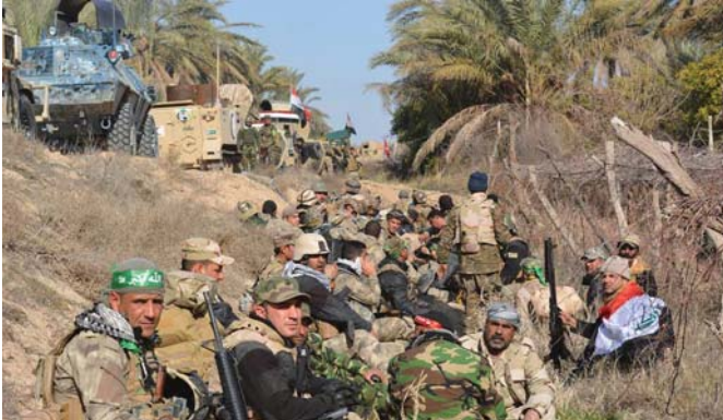
عناصر من الحشد الشعبي في ديالى