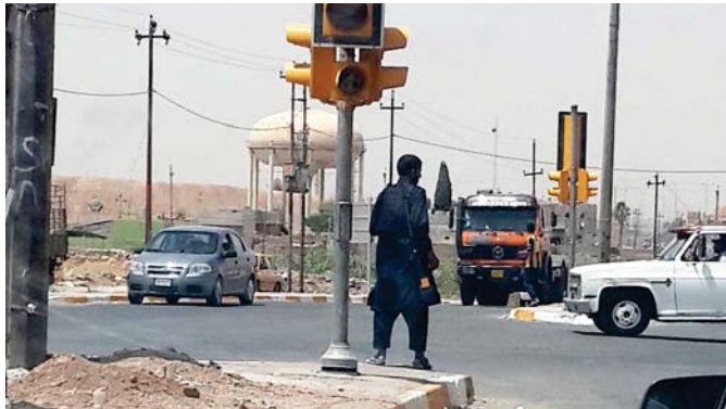
انتشار عناصر داعش في شوارع الموصل

وقال مصدر جنوب الموصل بصوتهم غاراتهم التي تتركز المدينة بعد تشديد الحناق عليهم بالرغم من عناصر التنظيم التي انطلقوا بجناح من الرصاص في الهواء بسحب مستشفيات المدينة ووزارة الطب العربي في ساعات متأخرة من الليل بشكل شبه يومي.