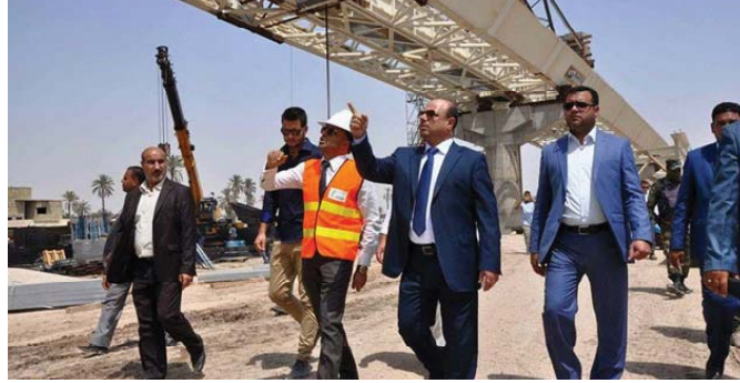
رئيس مجلس محافظة البصرة حضر رفع وتثبيت الهيكل الجديسي للجسر

العمل في جهة قضاء شط العرب يسير على وفق الخطة المرسومة، في حين العمل في جهة مدينة البصرة حدثت في الفترة الأخيرة توقفات والتي نسعى لحلها وازاتها واستمرار العمل به