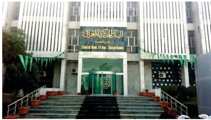
مبنى البنك المركزي العراقي

داعش هي الأعلى في نسبة القفر حيث سجلت نسبة 41%، وبمضي الهداوي الي الفتر. ان نسبة القفر في المحافظات الغربية بلغت 31%، في حين القوت نسبة القفر في المحافظات الوسطى 17%، وأكد ان بغداد كان نسبة القفر فيها 13%.