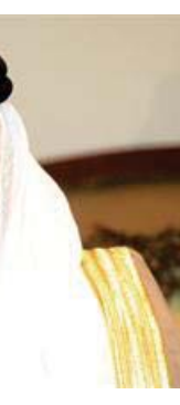
وزير الدولة لشؤون مجلس الوزراء الكويتي

ببساطة بين حجم الإمدادات وحجم الإنتاج بحسب حركة النفط داخل وخارج الخززين. وقال المصدر الإيراني يعتمد على احتياجات الزبائن إليها إشارة على أن السعودية تحاول مسارياً احتياجات الزبائن.