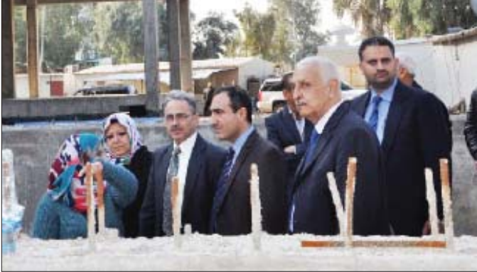
جانب من من جولات مفتش الوزارة للإطلاع على المشاريع

الفساد وعدم وعيها للأمنيين والفرص والبعثات الأجنبية في زمن بنام والفرص والبعثات الأجنبية في زمن بنام والفرص والبعثات الأجنبية في زمن بنام... (The text is partially obscured and repetitive in the original image, focusing on the main headline and the image caption.)