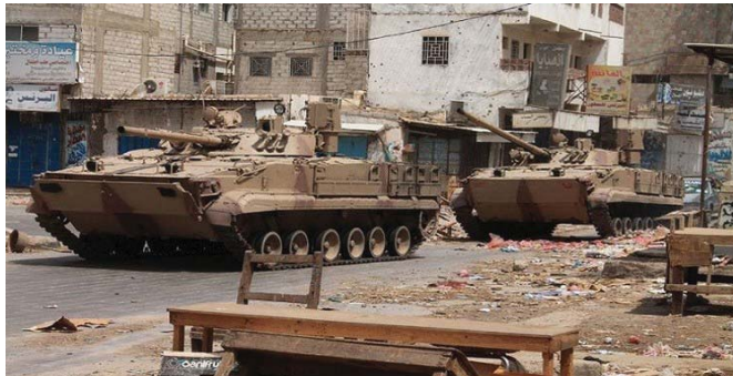
قوات عربية تصل اليمن

البحر الأحمر يهدد أمن إريتريا: أرسلت عدة من دول الخليج المشاركة في التحالف بقيادة السعودية أسس التعزيزات العسكرية إلى اليمن في مواجهة الحوثيين الذين يسيطرون على العاصمة صنعاء في الوقت الذي ظهر رأس جبل الاخلافت المشعة بين الرئيس اليمني عبد ربه منصور هادي وبنائه رئيس الحكومة خالد محفوظ بخاخ بعد أن طُقت على السطح أزمة طفت توصف بأنها مجرد «تباين» في الرأي في الرجلين حول قانونية استمرار تكليف وزير الصحة رياض ياسين عبد الله للقيام بأعمال وزير الخارجية في