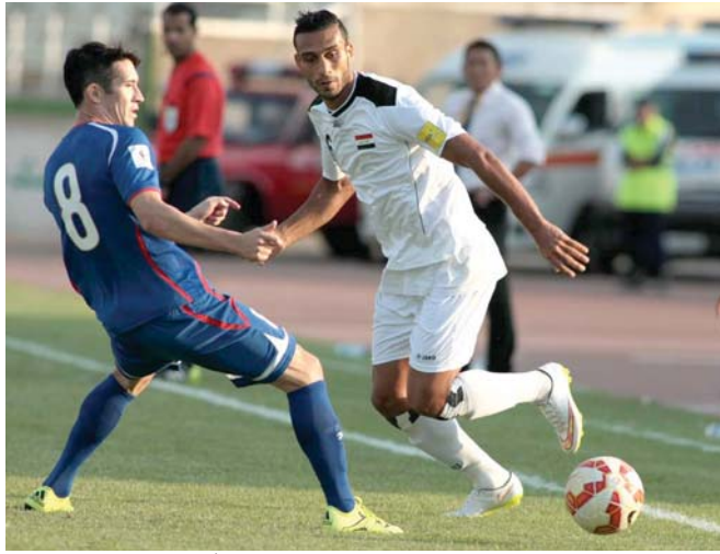
جانب من مباراة الوطني أمام الصين ثانيه