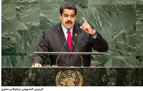
الرئيس الفنزويلي نيكولاس مادورو

وذلك للمرة الأولى ويُرَجَّح أن يكون ذلك لأغراض التجارة وتراجع في الأسعار لكثافات الحفوف منزوعة المزيكات العظمية إلى 15 سنتاً للبرميل فوق العادة أي بالخصاص نحو دولاراً من الريع السابق بحسب ما ذكره التحار. وفقاً لبيان وكالة الصحافة الفرنسية في 1 أيلول، وهو أعلى كلفة إدارية أعلن حازان أن «شركة النفط الوطنية» الجزائرية (سوناطراك) طرحت مناقصة لشراء نبع شحنتان من البنزين حجمها الإجمالي 270 ألف طن في أيلول ونشرين الأول، وأضاف أن المناقصة تتكون من خمس شحنتان بنزين 295 أوكتان للبوليمير في أيلول وأربع شحنتان لتفريغ في أيلول وذلك أكد مسؤولون أن سلطنة عمان تعيد جدولة بعض صادراتها من الغاز الطبيعي المسال في ظل ارتفاع الطلب المحلى على الغاز الكبريت الذي يزداد في نفس الغاز بما يلحق الضرر بالقطاع الصناعي. وتنجم كل صادرات السلطنة من الغاز تقريباً إلى اليابان وكوريا