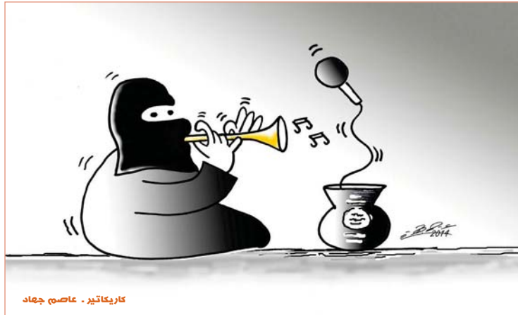
كاريكاتير - عاصم جهاد

عندما جئت لمل هذه التصرفات من المستويات الدنيا ووجهت شكري لمن يرتويها متوقفا من ظهور الامير العبد الذي وفر الازار اوما يارذا تلك وفي هذا الطرف العمير الذي تر به جمعاا وفر الرجل الاول في السلطة التشريعية للولمة فهذا يعكس جمود الهوان واليهوان التي انجريا اليه بعد الصريات الملتكة واخافته التي وجهت لمخلفوها للثوبت للثوبت والحبوب ان المكتب الاعلامي لسديم رئيس مجلس النواب بعد استتباع لمل هذه الخطوة بوصفاة استجابة لعدوة رسمية ووجبت اليه من فخر ولا علاق لها بتر الدوحة ويصفوه من قطاع الطوق والخطبوطين الجيوري الذي اخذ قامة السديم الجيوري هذا الصور العرفانية على استغفاليته في اخر باباتها هكذا وبكل مسخها بعفوا لخدش الامور بكل طيبة وواجهه وسادجة من دون الاتفات في حقيقة "الطرف الى مهم مشورس بالولاء الطيب والسامحة". اما لم يردت السامحة الجيوري لسديم سليم الجيوري نبع الجاهر ويلعب القوى الامارية والهوجبة التي تهدد وجودها وطبقه الغير حتى هذه اللحظة فغلبه التدخل من هذه السورلية الخفيرة وفعل الجاب زعمات اخرى تتنقل مكانه من لغة الطوائف والكليات التي اوصلتها عن طريقها السياسيين الى هذه الهولية والتمات الساجدة والهوليات الغربية والجمعة لعوام العالين صائل الوتون والسانس مرة اخرى تؤكد ان لا الاحداث واتبعاتها ان تقلل من اسرام ان يكون وما كما بنوم الجرض من ليقتسمة حسي الثورات والانتفاضات في الوقت الصالح.