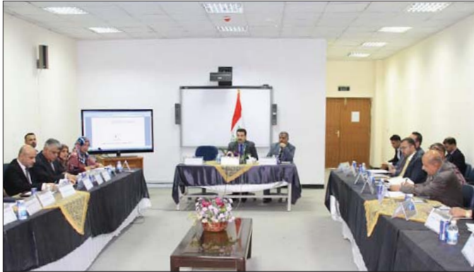
السوداني خلال ترؤسه اجتماعاً استثنائياً لمجلس العمل والشؤون الاجتماعية

بغداد - زينب الحسني: اعلن وزير العمل والشؤون الاجتماعية المهندس محمد شايخ السوداني اقرار مسودة مشروع قانون التقاعد والضمان الاجتماعي للعمال بعد اجراء بعض التعديلات المطلوبة على فقراته.