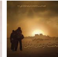
المصنف المعاني لفيلم

ويعم ذلك بعد يستمعته الماتية على الرغم من الضحايا التي ردها الدراجي ونهت لصالحه. وبحسكي "خت رمال بابل" قصة حرب الخليج 1991، حيث يقتر ابراهيم وهو جنسي عراقسي في الكويت في اعقاب انسحاب الجيش.