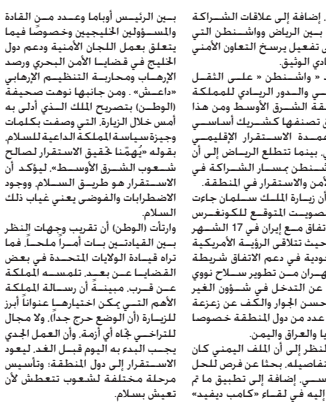
لقاء أوباما والملك سلمان

هجمت على أجدة القمعة السعودية - الأمريكية في واشنطن على الملك سلمان بن عبد العزيز والرئيس الأمريكي باراك أوباما ضمن تعزيز العلاقات الأمنية والاستراتيجية بين البلدين إلى مستخدمات الأوضاع في اليمن النظام الإيراني وحياه وعمد التزامة بأي مواطني مؤكدة الصحفية ان سلمان بن عبد العزيز والرئيس الأمريكي باراك أوباما ضمن تعزيز العلاقات الأمنية والاستراتيجية بين البلدين إلى مستخدمات الأوضاع في اليمن