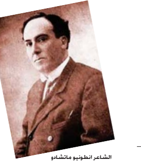
الشاعر انطونيو ماتشادو