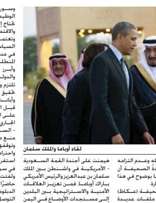
لقاء أوباما والملك سلمان

سوريا، إضافة إلى علاقات الشركة الوطنية بين الرياض واشنطن التي خنت إلى تفجير البرهان الوطني والاقتصادي الجوبي. «السبع» والسبتن» على الفضل السياسي السعودي الراسم للتملك في منطقة الشرق الأوسط، من هذا الجانب، من جانبها نعت صحيفة الوطن» التي تسمى الملك الذي أدى به خلال الزيارة التي صنعت تكلمات جديدة وسياسة الملكة الداعية للسلام، وبفوزة سيمتة الملكة الاميرة بعد شعوب الشرق الأوسط، ليؤكد أن استفرا هو طريق السلام، ووجود الاضطرابات والفوضى يعني غياب تلك السلام. وأرابت (الوطن) أن تغرب وجهات النظر بين القيايين بأن أصرا ملحا فما تراه قيادة الولايات المتحدة في بعض القضايا من بعيد نسمة الملكة في قرب، مبيضة أن رسالة الملكة الأمم التي يمكن اختيارها عنواً أبرز لترسانة (أن الصبح جرد)، وأن مجال العمل جاه أن أمة، وأن العمل الجهد يجب ان يه في اليوم فضل فقد يعود الصفر، إلى في المنطقة، وتأسيس مرحلة مخالفة لشعوب تعطلن لأن تعيش بسلام.