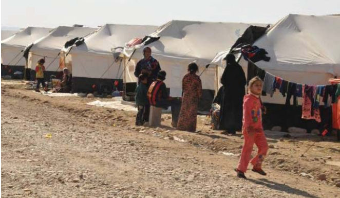
مخيم للنازحين في ديالى