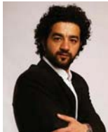
المخرج محمد المرابي

ابراهيم محسوم، يتنفض سكان الجيوب العراقي خارج اسوار السجن غارسين امل الحرية في نفوس الاسرى والعذابين. بعد هذا الترشيح استمررا للنجاح والشراكات العالمية التي حققها المركز العراقي للفيلم المستقل، وخصوصا في هذا الوقت حيث حصد المركز جائزة السد الكريستالي في مهرجان برلين السينمائي الدولي عن فيلم "هدية أبي" للمخرج سلال سلمان وحصول فيلم "ملحكة الفتيات" للمخرج ياسر كريم على تنويه خاص في مهرجان تريبيكا للفيلم الدولي وحصول فيلمي عيد ميلاد للفرح وهديت جبال على جائزة السلام وهدية امين على جائزة افضل اعمد ياسين على التنويه الخاص من مهرجان باسايو السينمائي الدولي في إيطاليا، كما اعلن المركز عن ترشيح فيلم "طريق الكفة" للمخرج عطية الدراجي لمرحلة ما بعد الافتاح في مهرجان البندقية السينمائي الدولي ايضا.