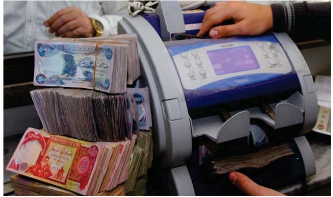
السلم الجديد: تخفيض رواتب الدرجات العليا