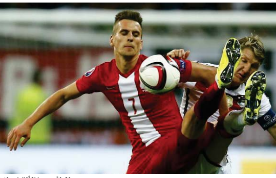
لغطة من مباراة ألمانيا وبلجيكا

بانتظام في مباريات فريقه ببارين الذي سجل لغيره الأهداف الأربعة في المباراة الأولى