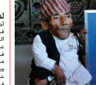
دبي - سكاي نيوز: توفي النيبالي تشاندرا بهادور دانغي الذي يحمل رسميا لقب الرجل الأقصر في العالم، بإحدى المستشفيات في ولاية كاليفورنيا، حيث تقارب إصابته بمرض ورم خبيث، وهو يبلغ طوله 54.6 سم نال لقب أقصر رجل في العالم في عام 2012. ورغم عدم الإفصاح عن سبب الوفاة إلا أن مصادر صحفية رجحت

الذي يبلغ طوله 54.6 سم نال لقب أقصر رجل في العالم في عام 2012. ورغم عدم الإفصاح عن سبب الوفاة إلا أن مصادر صحفية رجحت