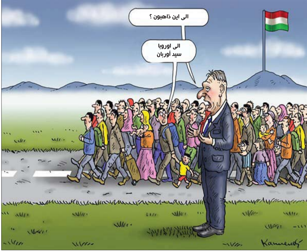
عن موقع «كارتون سياسي»