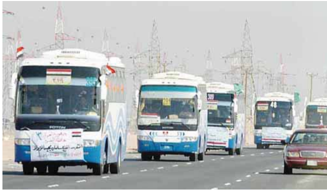
قوافل نقل الحجاج