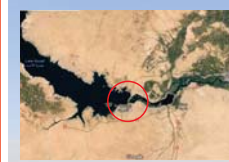
سد الفرات في منطقة الطبقة السورية