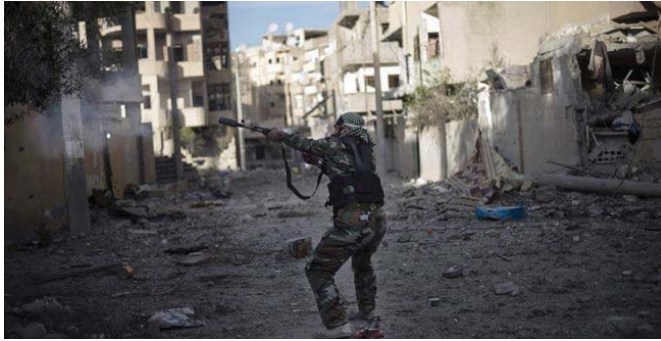
جانب من الاشتباكات في سوريا

هذه التقارير عن كتب، في موسكو نمت مسؤولة وسعي التغيير، وقالت ماريا أخارفا المتحدة باسم الخارجية الروسية إن موسكو لم تحف أنها تقدم ما وصفته بالتمسك الفني للسلطات السورية في مكافحة وكتابة ناس الروسية عن إخباروا قولوا في مؤرخ صحفي ترابت نقول في النشر طائرات في الآن السورية كما قرأت أيضا تعلقنا هؤلاء الصمد من وزارة الدفاع الروسية والزيادة الروسية تعد هذه المعلومات»