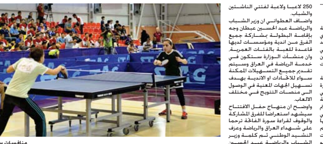
مناسبات سابقة بكرة الطاولة