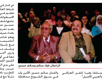
الرحيل فؤاد سالم وسالم حسين سابقا وفيما للفن العراقي والفنان سالم حسين الأمير ولد في سوق الشويخ محافظة

بغداد - الصباح الجديد: غيبت الصوت أسمن السنت الموسيقار العراقي الكبير سالم حسين الأمير. عن 92 عاماً. مخلقا وريته منجزا فنيا كبيرا. وتعداه الموسيقي الفنان الشخصي في موقع التواصل الاجتماعي فيس بوك. قائلا: «الرافدي العربي هذا اليوم كثرنا نحيما وعسلافا من عداقة الفن العراقي والعربي قائلا: "عني الراعي الأصيل العراقي والعربي الذي لم يسلط الضوء على هذا الانسان الراي طيلة فترة حياته وحتى يوم وفاته. رحمت الله يا سناذي الكبير واسكنك فسيح جناته وسأكون كما عهدتكم