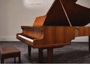
ومن المقرر إقامة المزاد في لندن في 29 سبتمبر.