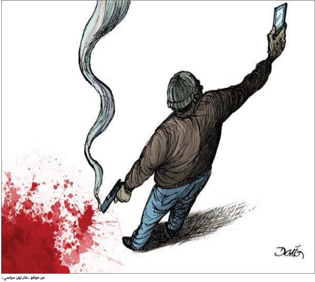
عن موقع «كارتون سياسي»