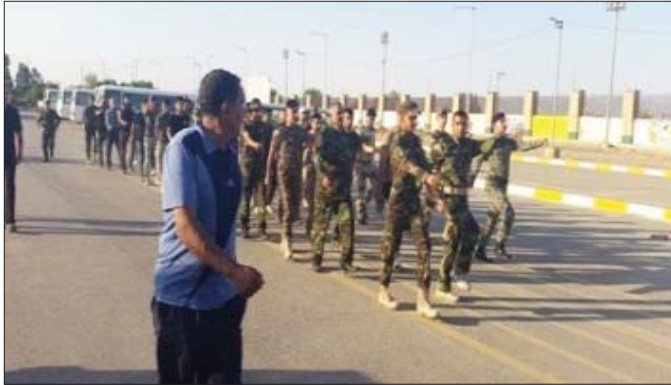
جانب من فعاليات الحفل

اجرى رئيس الهيئة العليا لحشد الثورة والجمعة الشيخ الدكتور خالد العطية اتصالات هاتفية مكثفة وبشكل متواصل منذ انطلاق اول الحركات في الديار القديسة مع مدير مكتب شؤون حجاج العراق في المدينة المنورة ومكة المكرمة وروساء الديار الاطلاع على الخدمات المقدمة للحجاج العراقيين في ايام حجهم ووجه الشيخ العطية في بيان صادر عن مكتبه أطلقت « الصباح الجديد» على نسخة منه الجمان المختصة في التكتين بتفهم افضل الخدمات للحجاج العراقيين والحرس على ان يكون سلكهم في افضل الفنادق القريبة من المسجد النبوي الشريف . إضافة الى ضرورة تقديم الوجبات الغذائية الجيدة بما يراعي الحالات الصحية للحجاج الكرام.