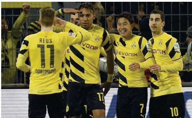
لاصو دورتموند "أرشيف"

أربعين عاماً، وسبق لتوتنهام أن تغلب على أورتش في نهائي كأس الاتحاد الأوروبي عام 1994. حيث فاز وقتها ببركات الترجيح بعد تعادل الفريقين 1/1 في كل من مباريات الذهاب والإياب. ومع إقامة نهائي البطولة في بازل بأمل فريق بازل السويسري في العصور من المجموعة التاسعة التي تضم معه فيرندينا الإيطالي وليج بورسان البولندي وبيليستيميل البرتغالي. وأولمعت الفرقة فريق ميمبرو مينوريفوسسكي الأوكراني وصيف بطل النسخة الماضية في المجموعة السابعة التي تضم معه فريق لانسوي الإيطالي وسوانت اتبان الفرنسي ووزنخ التويجي. ويخوض نابولي الإيطالي ومغالبات هذا الدور ضمن المجموعة الرابعة التي تضم بورج الملجيكي وليجا وارسو البولندي ومينيلاند الفناركي فيسوا بيلجوس مارسيليا الفرنسيين هذا الدور ضمن المجموعة السادسة التي تضم أيضاً سورتينج براجا البرتغالي وسوليفان ليريشل التشيكي وجونينج الهولندي. وفي باقي فترات هذا الدور يلتقي فيرلار الألماني مع فيسوا بيلجوس بلزن التشيكي وريسل فيينا النمساوي وبنامو ويستامد الليتواني في المجموعة الخامسة وسورتينج ليشونيه البرتغالي مع بلنكلان الكركي وسبارتان موسكو الروسي وسكندرنيو الألباني في المجموعة الثامنة.