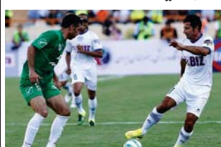
جانب من المباراة

الحرة الصاروخية التي أشتهر بتسجيدها. وأقيمت المباراة بهدف جمع الأموال لصالح رعاية المرضى الصغار بمتصلب الشرايين.