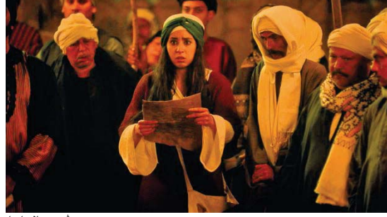
مشهد من المسلسل

ومضية ومغشلة بفجار الزمن. ويوجد كتاب حاكم أمر وتوجد فرق متصارعة على أن حكم مزاعم أن حكمه ترفض من الكتاب. حروب وحلفاء تقام وتنفذ. اندعاءات ومناورات كل ذلك يدكرنا بحال الأديان الازهرية والفضاحة وحال الرغبة في الكفور الثلاثة بحيلنا فوراً لترايسن في علاته بالسلطة منذ الازل بين القمع والمقاومة، الاستسلام، والعصيان. وهذا بعد التحديد، الدفون بين السقوط والمغزول في نثاا الدراما هو ما جلب الكثير من الانتقادات على مسلسل. "العهد" في نثاا الدراما، والحفاظن وازام الثيرات الدينية، معصوي ان شذوية كسيرة الغير منطقة شاذة كس الدين والذات الازهرية. تبتسي المعطفت الدرامية في مسلسل "العهد" في شكل كود ثمة مساحه كافية في الماراتبات واللامنطق يسمحن لاي معرج مرامي بالوصول فمرة بنفض حلف بين طرفين ليقام اخر بغلطة طرف ثالث ومرة لتعب الاغنية والفضاحة دورا في تغيير مسار الأحداث، وبخاصة عندما يقول الكبريهوليب المرفاسفرح عن معرض دفاعه عن إحدى قراراته (نحن من نحكم بالعهد.. ولا يتحكم فينا). وهكذا