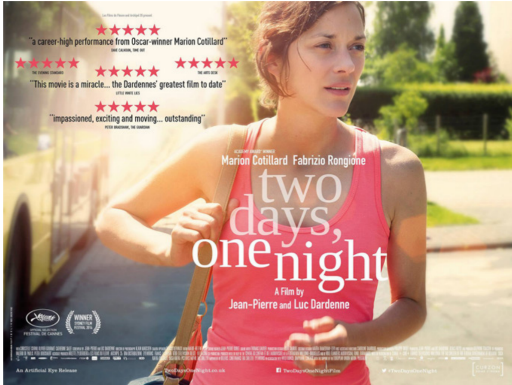
المصق الدعائي للفيلم

في هذا الفيلم قدم الأخوان داردين فيلماً درامياً بقدر كبير من الواقعية التي يعيشها الناس في هذا العصر، لقطات طويلة بكاميرا محمولة، اعتماداً الصوت الطبيعي للحركة وحوار مكتوب بعناية فائقة لم يستعمل أي مؤثرات ولا حتى موسيقى تصويرية تساعد في تكثيف الخط الدرامي