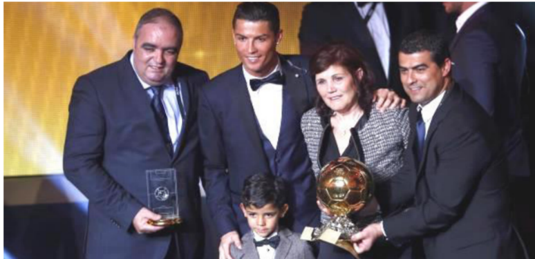
رونالدو مع أسرته

وللعلم الثاني على التوالي ينجح رونالدو في التفوق على غريمه ميسي. بعد أن كان قد تفوق عليه أيضا الموسم الماضي وعلى الفرنسي فرنك ريبيري (بايرن ميونخ الألماني).