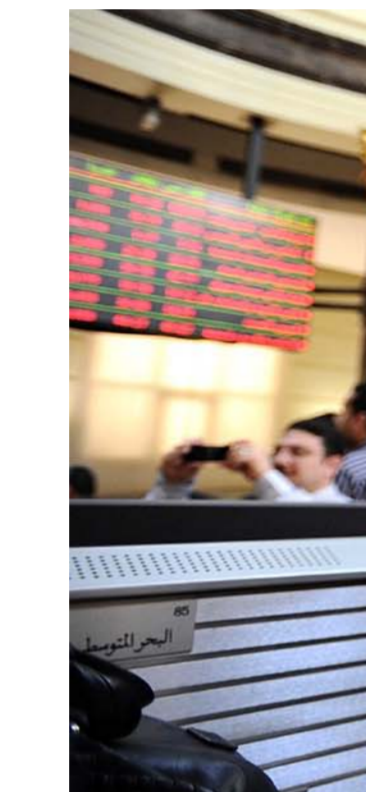
بورصة الدولار والعملات الأخرى "أرشيف"

إضافة إلى إن البنية التحتية في العراق سيئة جدا، والتي تصيف على تقديرات السعر، فإن الوضع الأمني في العراق سيء بكل المقاييس ويعتبر ساحة حرب!! ما يتطلب إضافة مبالغ هائلة من قبل الممولين إلى السعر كضمان لكل احتمال، ووضع شركات حماية للمشروع والعاملين على إنشائه. بالإضافة إلى الوضع "الفردي" في العراق من الروتين القاتل (للسبب أو لآخر) وإذلال في الحصول على الموافقات في إدخال المواد ونقلها ونقل العاملين وتأخير إعطاء سمات الدخول، واحتمالات "الرشوة" العالية في مختلف المرافق. مع احتمالات تخلفات مختلف الجهات الحكومية والأمنية والحزبية والعشائرية، وكلها تضاف إلى الكلفة. كذلك هناك تأخيرات في مصادقات التصاميم، وصرف الفغات والموافقة عليها أصلا، تصل هذه التأخيرات إلى شهور طويلة، كما يحدث مع شركات النفط العالمية التي وقعت عقود "الخدمة الفنية"، ما حدا بشركات عملاقة مثل برتش بتروليوم وتوتال إلى التهديد بترك العمل لأنها تتعرض لخسائر لم تحسبها أصلا. كل هذه الأمور جعلت المقاول يضيف على سعره ما لا يقل عن (30%) مقارنة بأي مكان عمل آخر على الأرض. وقد يتضيف أكثر من هذه النسبة، ولذا يرتفع السعر من (4.84) مليار إلى (6.29) مليار، ولو أضاف (25%) فقط سيرتفع السعر إلى (6.05) مليار دولار!؛ وهذا أمر واقع لمن يريد أن ينفذ مشروع في مثل هذه الظروف!!