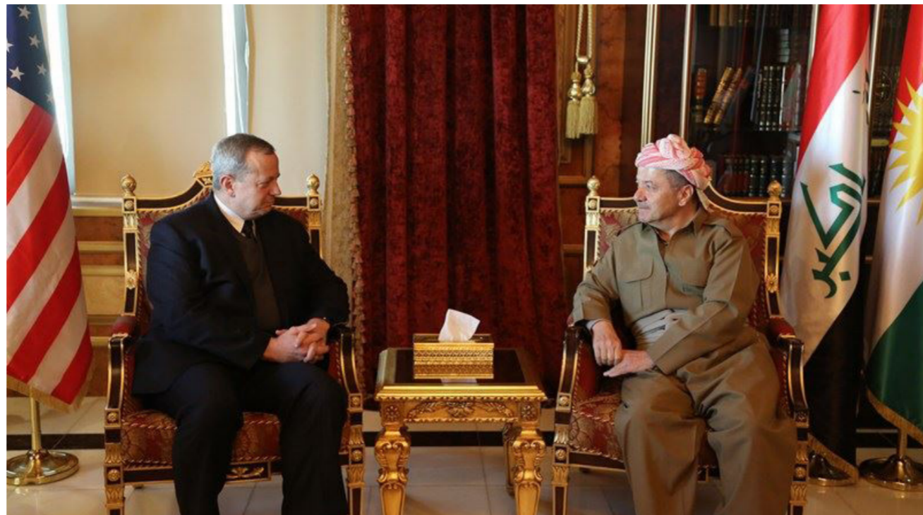
بارزاني المبعوث الخاص للرئيس الأميركي

جون آلن: العالم يحترم الدور الذي يؤديه الرئيس بارزاني وصمود شعب كردستان وبمسالة قوات البيشمركة في مواجهة الإرهابيين وفي استقبال وحماية مئات الآلاف من النازحين