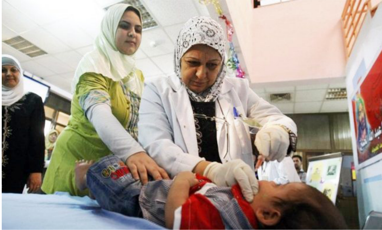
جانب من حملات الوزارة لتلقيح الاطفال "ارشيف"

المستلزمات الطبية وشمولهم بالخدمات المقدمة من مراجعة المستشفيات والمؤسسات الصحية من دون اية اجراءات او احالات مسبقة . كما اطلع الفريق على الاحوال المعيشية والحياتية للنازحين في المنطقة ونقل كل ما يتعلق بوضعهم الحياتي والمعيشي الى المسؤولين والوزارات والمؤسسات الحكومية الاخرى بهدف توفير جميع المستلزمات الحياتية الضرورية لهذه الاسر .