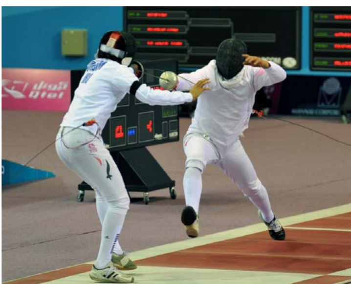
لقطة من منافسات المباراة "أرشيف"

الاستفادة من الخبرات المتطورة لتعزير دور الملاكات التدريبية واللجان الادارية والفنية. ويتحمل الاخاد العراقي للمباراة خمسة ايام. إذ من المقرر ان تنطلق صباح يوم امس الثلاثاء في مقر المركز الوطني للمباراة بالمدينة الشبابية وتستمر لغاية السابع عشر من الشهر الجاري. وسبق لي ان اشرفت على دورات بالصفحة ذاتها. الاولى باشراف الاخاد الآسيوي واقامت في الكويت والثانية في الامارات ويتوجه من الاخاد العربي.