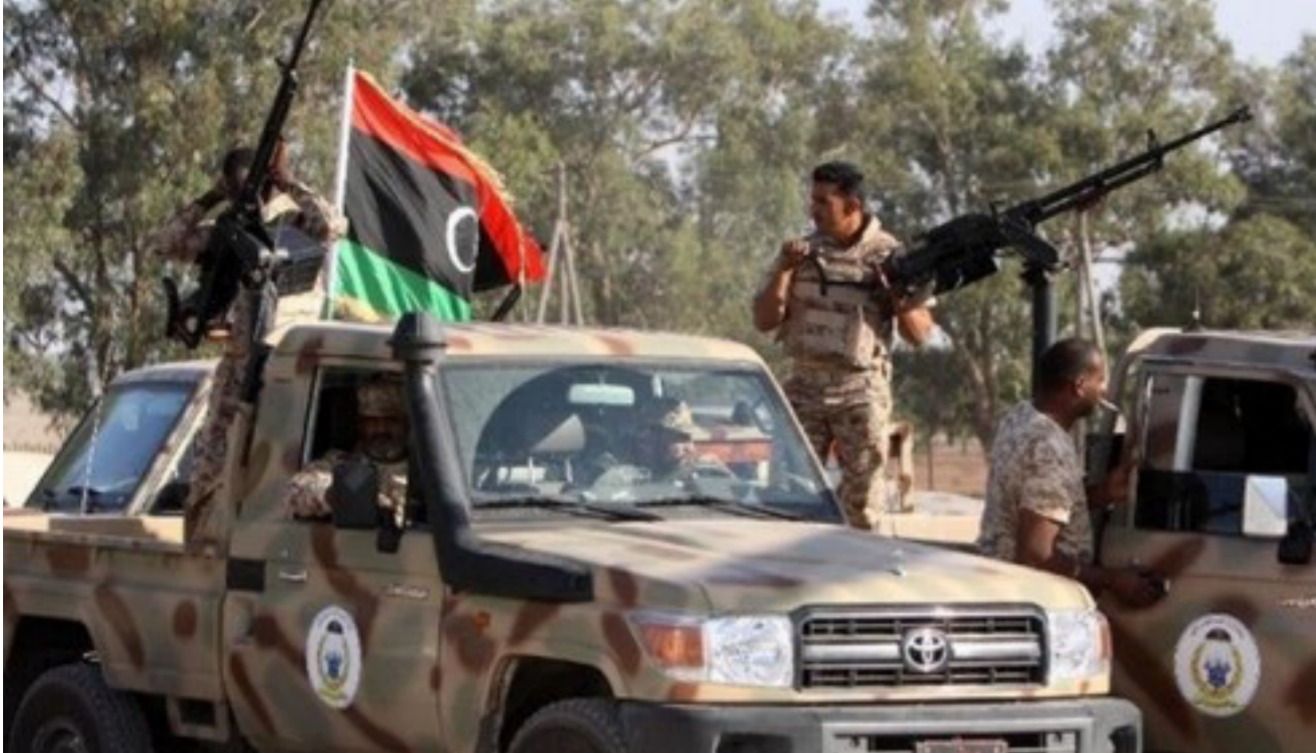
مسلمون يتظاهرون ضد الإرهاب في فرنسا حاملين شعارات تقول الاسلام ضد الارهاب

وأضاف آرون « بريطانيا لم تقدم دعماً عسكرياً إلى أي من الجانبين في ليبيا، وأي شائعات حول هذا الأمر لا أساس لها من الصحة». وانتهت صلاحيات المؤتمر الوطني العام في ليبيا بعد الانتخابات التشريعية التي أقرت في حزيران الماضي مجلس النواب والحكومة الليبية المعترف بها دولياً برئاسة عبدالله الثني، لكن المؤتمر العام بدعم من ميليشيات متشددة رفض تسليم صلاحياته وعين حكومة برئاسة الحاسي دون أن توافي اعترافاً دولياً.