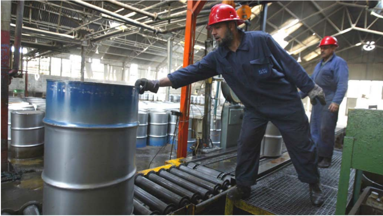
257 الف برميل يومياً أنتاج حقول ميسان

تقوم شركتنا سينوك وبتروجابنا الصينيتان بتطوير أربعة حقول كبيرة من حقول نفط ميسان. وقد وصلت معدلات الإنتاج لهذه الحقول إلى أكثر من 230 ألف برميل يومياً يتم تصديره عبر موانئ البصرة.