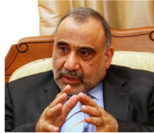
عادل عبد المهدي

بغداد - الصباح الجديد : اتهم وزير النفط عادل عبد المهدي. أمس الثلاثاء، دولا إقليمية لم يسهما بعدم السماح لوصول النفط إلى أسعاره الحقيقية. وقال عبد المهدي في بيان ورد الى «الصباح الجديد» إن «هناك بعض الدول الإقليمية لا تسمح بوصول النفط إلى أسعاره الحقيقية». وكان وزير النقل باقر الزبيدي حذر