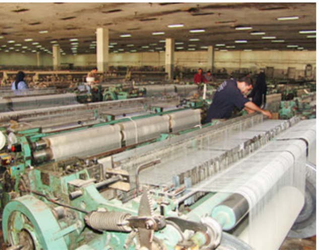
احدي معالم القطاع الخاص "ارشيف"

بذكر ان وزارة الصناعة كلفت شركة الرشيد العامة احدي شركات الوزارة بتنفيذ اعمال التأهيل على وفق الاساليب الحديثة للانشاء مجهزة بنشاشة عرض واجهزة تكيف لتلبية متطلبات تقديم الخدمات للمواطنين وسيكون مبنى معرضا للتفتيش من قبل لجان تفتيش خاصة تابعة للامانة العامة لمجلس الوزراء على الخطوات المتخذة من قبل الوزارة بخصوص تنفيذ معايير الخدمة الحكومية . وكيل وزارة الصناعة للتخطيط بوجه ضرورة زيادة الدعم المقدم للصناعيين لتفعيل اسهام القطاع الخاص في الانتاج الوطني .