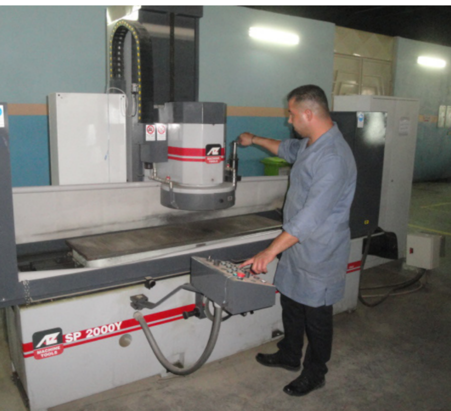
احدى معالم الشركة "أرشيف"

بمواصفات القياسية الدولية كدليل عمل ثابت إضافة إلى ذلك فإن مراحل العمل تدعم ببرامج تدريبية تخصصية. واوضحت الشركة ان كرسيت جهودها لتحسين وتطوير قدراتها التنافسية في المجالات التي تدخل الجودة لاسيما اضافة الى الالتزام بالاداء البيئي الفعال للشركة وحقن المواصفات المطلوبة بشكل يفوق توقعات الزبون من خلال اعتمادها منهجية متميزة تهدف بدرجة أساس إلى إنشاء نظام فعال يرفع الجودة العاملية في الشركات لكافة القطاعات ويتفاعل معها من أجل تحقيق أهدافها وتطلعاتها في مجال جودة السلع والخدمات التي تقدمها. الامر الذي أسس ركيزة قوية لدعم وخفيز ومساعدة الشركات نحو اعلاها لتؤكد ان المواصفات المطلوبة في خدمة او سلعة معينة سوف يتم الحصول عليها بالشكل الامثل وفي كل مرة بأجح وأكفا الطرق بهدف مواكبة التطور العلمي والصناعي في العالم وللتطور الصناعي الحاصل بالعراق والارتقاء الى اعلى المستويات.