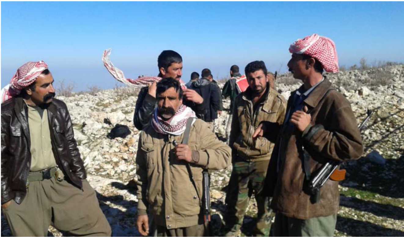
مقاتلون إيزيديون في جبل سنجار

في الثامن عشر من شهر كانون الأول 2014، من طرد تنظيم داعش من غالبية أجزاء قضاء سنجار بعد معارك استمرت لنحو 72 ساعة. وسيطر تنظيم داعش على معظم أجزاء قضاء سنجار الذي تقطنه أغلبية من الكرد الإيزيديين في الثالث من آب المنصرم. وتحدثت تقارير صحفية وناشطين إيزيديين عن قيام التنظيم بارتكاب جرائم بشعة، من قتل وخطف وسبي الآلاف من الإيزيديين المدنيين.