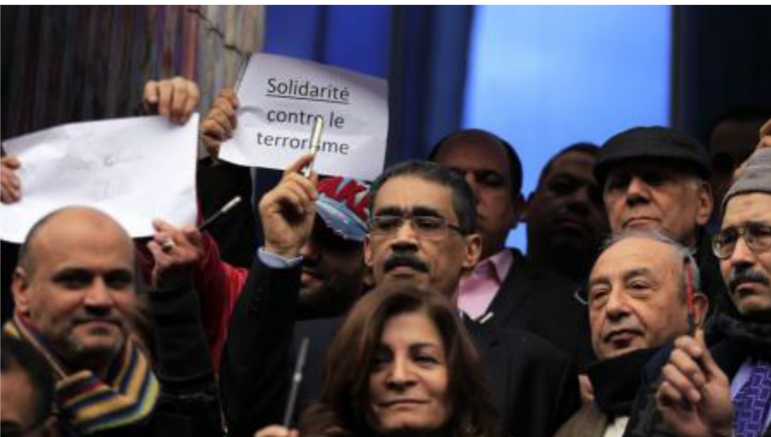
وقفة أمام نقابة الصحفيين المصريين للتضامن مع صحيفة شارلي إيبدو الفرنسية بعد الهجوم عليها

وهو رسم للنبي محمد. وعبارة «أنا شارلي» وكتب على أعلى الرسم عنوان عريض «كل شيء مغفور» في عبارة تهدف إلى التهدئة وتتناقض مع أسلوب الصحيفة الهزلية. وكانت عبارة «أنا شارلي» قد انتشرت بشكل واسع في فرنسا وفي أماكن أخرى حول العالم تضامنا مع مجلة شارلي إيبدو بعد الهجوم المسلح على مكاتب المجلة أسفر عن مقتل 12 شخصا بينهم رئيس تحريرها وعدد من رساميه في السايح من الشهر الحالي. وقال المتحدث باسم مؤسسة «إم. بي.إل». المسؤولة عن توزيع شارلي إيبدو، ميشيل ساليون، إن دفعة مبدئية تبلغ مليون نسخة ستطرح للبيع الأربعاء والخميس، ومن المتوقع طباعة مليوني نسخة أخرى بناء على الطلب. وأضاف ساليون قائلا «تلقينا طلبات شراء 300 ألف نسخة من مختلف أنحاء العالم والطلب مستمر على مدار الساعة». مشيراً إلى أن الألف فائز