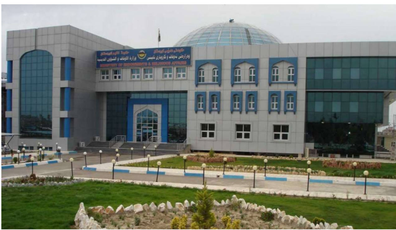
مبنى وزارة الأوقاف

ولدينا إجراءات عقابية بحق كل من يسيء لطائفة معينة أو أي