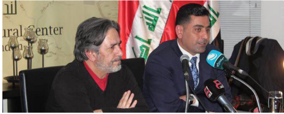
جانب من الامسية التي قدمها المخرج جمال امين

ركز دياب في فيلمه على الحياة ومظاهرها وهي تحدى الموت والحقد على كل ما هو جميل. عرفنا على قرية لم نسمع بها من قبل. رائحة الخبز تفوح من مشاهد المرأة وهي تخبز وسط اصوات المدافع والضرب.. الزوارق تهدي في مياه دجلة وقد صارت هي وسيلة النقل الوحيدة «لا بد من مواصلة الحياة بالرغم من القصف والرمي.. فبعد ان كان النقل بالزوارق وسيلة للتسليية.