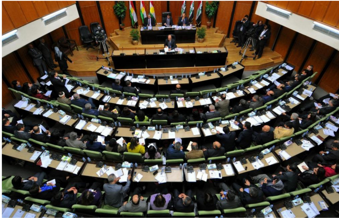
مجلس البرلمان الكردستاني "أرشيف"

الإرقام مختلفة هناك من يقول مائة ألف ومن يقول 50 ألف وليس لدينا أي رقم أكيد حتى الآن ، وعندما تصلنا إحصاءات كافة الوزارات والدوائر سيتبين لنا العدد الصحيح