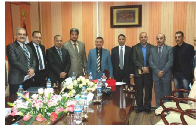
وقد وزارة الشباب خلال زيارته مديرية شباب الكرخ