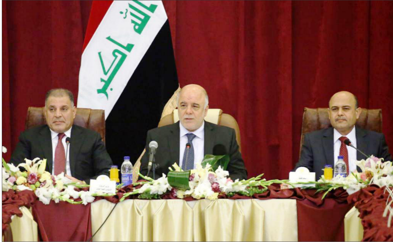
العبادي في اثناء اجتماعه مع مجالس المحافظات في البصرة "ارشيف"