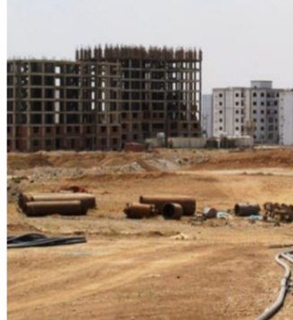
أحد المشاريع السكنية في الإقليم

من عدم وجود ازمة مالية في تلك السنوات، ودعا هيئة النزاهة في الإقليم الى التحقيق في الأمر.