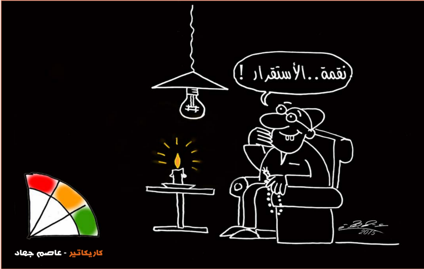
كاريكاتير - عاصم جهاد

يُذكر أن «موسى» سببئضم لأبناء «جولي» و«بيت» السنة وهم مادوكس 13 عاماً. باكس 11. وزهرة التي تبنتها من «إثيوبيا» 9 سنوات. وشيلوه 8 والثوم فيفان ونوكس البالغان من العمر 5 سنوات.