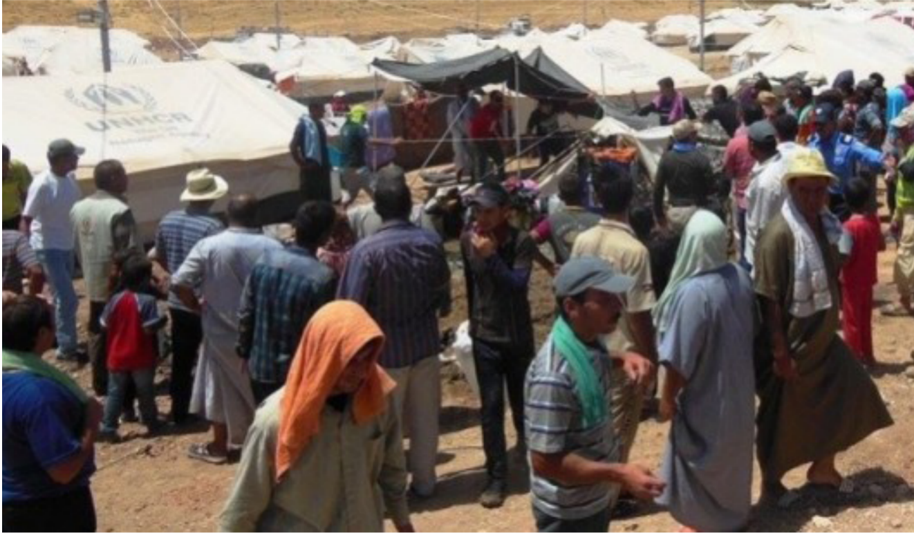
أحد مخيمات النازحين في كركوك

صلاح الدين». لافتاً إلى أن الأشهر الستة القادمة ستشهد افتتاح هذا المجمع السكني من أجل إسكان نازحين فيه. يشار إلى أن عوائل كثيرة من محافظات نينوى وصلاح الدين وديالى ومناطق تلعفرطوطوخورمانو وسليمان بيك ونواحي الرياض والزاب والعباسي والرشاد والملقى وتازة وقضاء دافوق نزحت إلى مدينة كركوك بسبب سيطرة مسلحي «داعش» على مساحات واسعة من مناطقهم في شهر حزيران من العام الماضي.