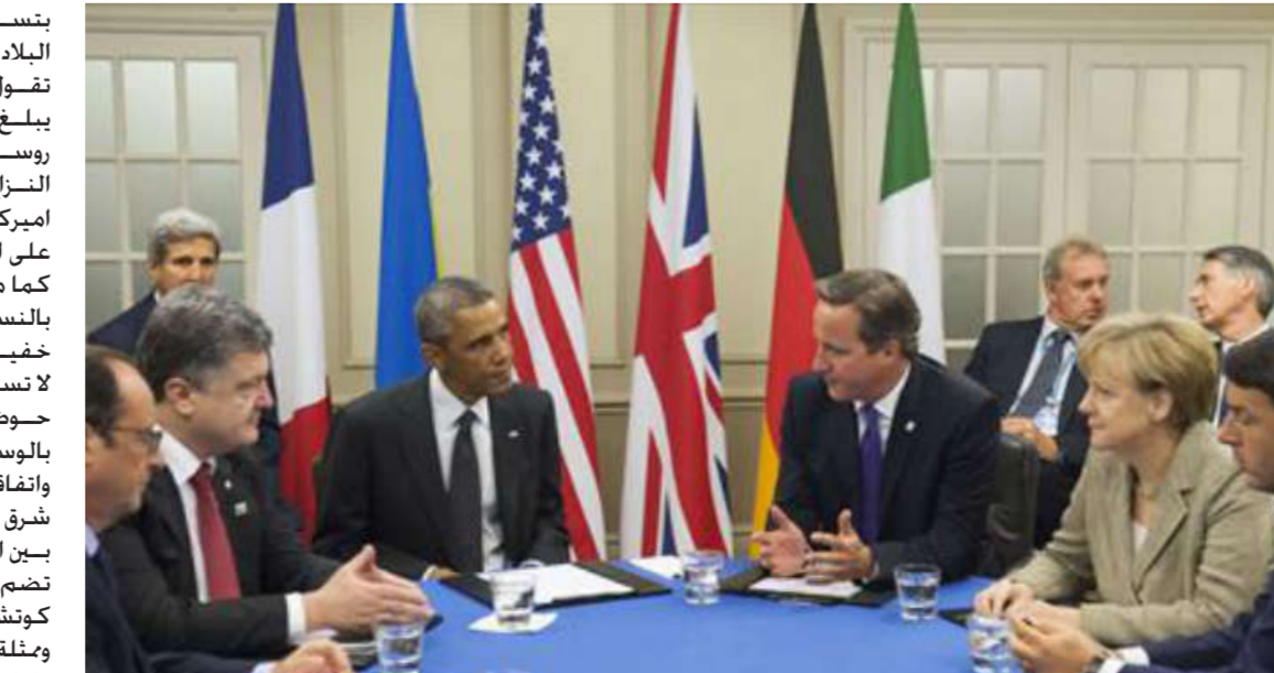
أحد اجتماعات القمة للئاتو السابقة بشأن الأزمة في أوكرانيا

بتسليح التمرد الانفصالي في شرق البلاد وينشر قواتها النظامية التي تقول وزارة الدفاع الأوكرانية ان عديدها يبلغ 7500 جندي حتى الآن. وتعرضت روسيا بعد ضمها القرم ودورها في النزاع في شرق أوكرانيا التي عقوبات اميركية واوروبية بدأت تلقي بثقلها على الاقتصاد والعملية الوطنية. كما من المتوقع ان تكون القيمة حاسمة بالنسبة لروسيا التي تسعى الى خفيف العقوبات وكذلك أوكرانيا التي لا تستطيع استعادة السيطرة على حوض الدونباس للمناجم في الشرق بالوسائل العسكرية. واتفاقات السلام الوحيدة الموقعة بشأن شرق أوكرانيا في ايلول في مينسك تمت بين التمردين ومجموعة الاتصال التي تضم الرئيس الأوكراني السابق ليونيد كوتشما وسفير روسيا في أوكرانيا. وبمثلة منظمة الامن والتعاون في اوروبا. وقبل التوجه الى برلين استقبال لافروف في موسكو نظيره من لاتفيا ادغارز