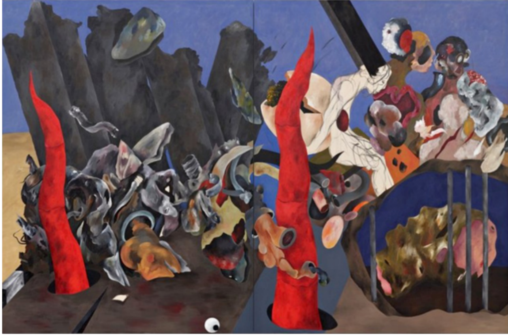
لوحه للفنان أحمد السوداني