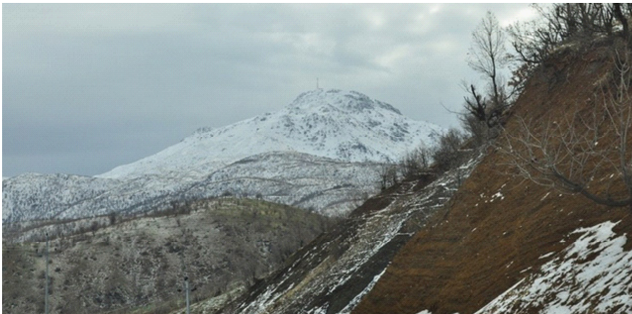
تساقط الثلوج في الإقليم

في المنطقة «وهي في الوقت ذاته خطوة مشجعة للفلاحين كي لا يتراجعوا عن عملهم