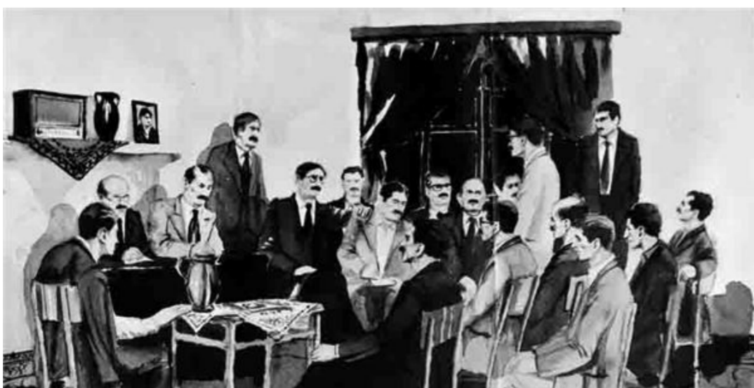
حزب توده "رشيف"

تفكك حزب توده و انتهى كقوة فاعلة في الحياة السياسية في ايران. اما صحف طهران، فقد كتبت تقول "إن اعضاء اللجنة المركزية اعترفوا بالتجنس لصالح جهاز الـKGB، و إن حزب توده إنما تأسس من اجل هدف التجسس و العمالة، و إن اعترافات اعضائه و قيادته إنما تمثل اعترافات لا سابق لها في تاريخ العالم و حسب