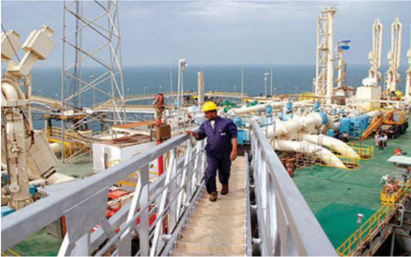
احدى منصات تصدير النفط العراقي

آسيا بين 55 سنتا للعربي الخفيف السوبر. وهو أجدد أنواع النفط الذي تتبعه «أرامكو». 70 سنتا للعربي الثقيل. وهو أقل الأنواع السعودية جودة.