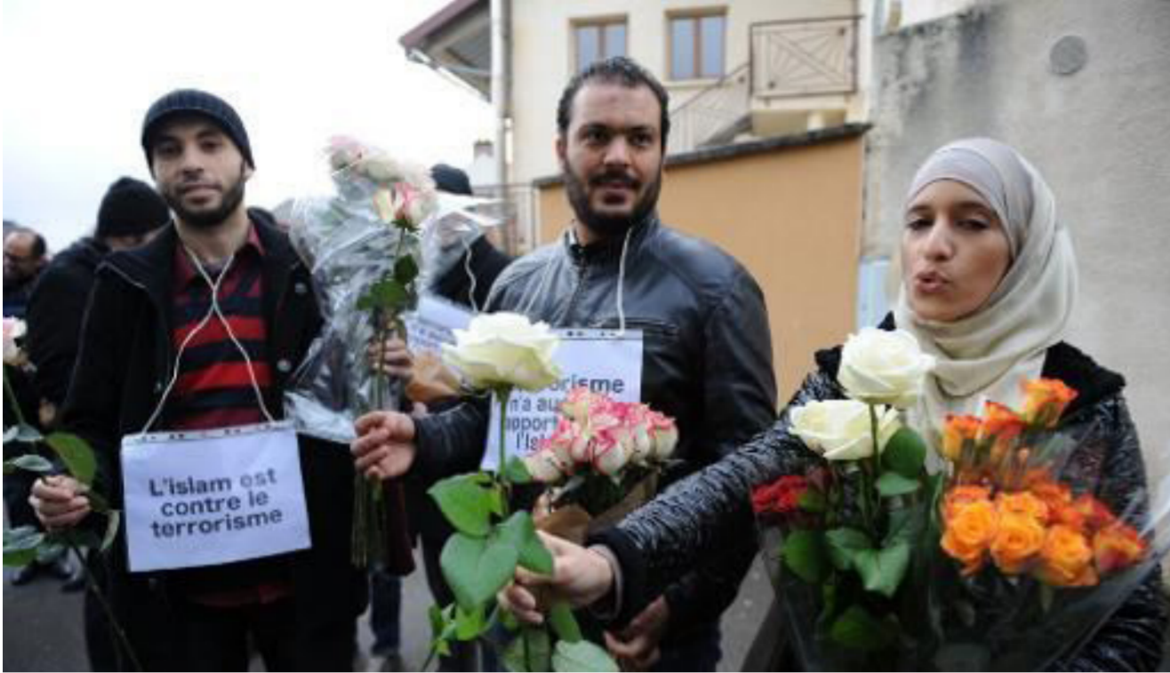
مسلمون يتظاهرون ضد الإرهاب في فرنسا حاملين شعارات تقول الاسلام ضد الارهاب

المعلومات بشأن حركات الإرهابيين، واخذت الأجهزة الفرنسية مرارا في الأونة الأخيرة على الاستخبارات التركية عدم تعاونها في مكافحة الشبكات الجهادية التي سمحت لآلاف المقاتلين الأوروبيين بالالتحاق بسوريا عبر الأراضي التركية. وفي أيلول تعهد وزير الداخلية الفرنسي برنار كازنوف ونظيره التركي افكان علاء بالتعاون بشكل أفضل لمحاربة الشبكات المتطرفة التي تعبر تركيا. وذلك بعد خلل دبلوماسي امثي واكب رجوع ثلاثة فرنسيين يشتبه بانضمامهم الى