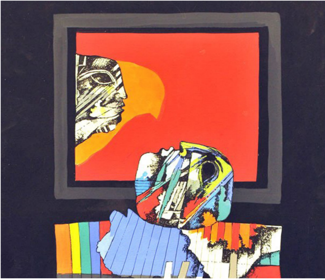
من أعمال الفنان ضياء العزاوي

أشرت بيدي إلى جهة غائمة، لم تلتفت وبقيت تنظر إليّ، فقلت: من الأفضل أن ترجعي سريعاً. أعتقد أن هذه الجولة البحرية متعشة، ومن المؤكد أنت الآن أحسن. سألتني: من ماذا تتكلم؟. قلت: ظننت أنك تفكرين في العودة. انكمش وجهها. أخرجت الهاتف، وتلمست شاشته، قلت لها وقلبي يدق بسرعة: رائحة الياسمين قويّة. وضعت الهاتف على أذنها. - يوجد مرآب لحافلات نقل الركاب في المكان الذي ترسو فيه العبّارة.. تعال وخذني من هناك.