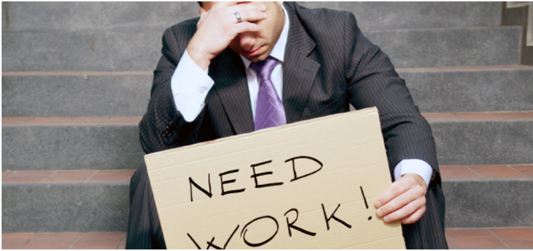
الحصول على العمل حق انساني مكفول

والريادة. وفي الوقت نفسه. يجب التقليل من تركيزنا على المهام التي يمكن ان تقوم الآلات بها. واقتصد المراقبة والحساب والتنفيذ والأجاء الصاعد لهذا الإجاه هو أن من يفقدون وظائفهم نتيجة لزيادة الإنتاجية سيتم خربهم من اجل ان يقوموا بأمر في قطاعات أخرى. وهناك. على سبيل المثال. فرصة كبيرة هنا لاستخدام هذه الفترة لمعالجة أوجه القصور في البنية التحتية. فمن ناحية لدينا البنية التحتية المتأكلة في مناطق كثيرة بما في ذلك - المطارات وشبكات السكك الحديدية وخطوط الأنابيب ونظم الاتصالات السلكية واللاسلكية. ومن ناحية أخرى. لدينا الانخفاض القياسي بمعدل الفائدة حين الاقتراض. مع ارتفاع كساد يكون قياسيا في البطالة في قطاع البناء وفي الموارد غير المستخدمة. وفي النهاية أنا متفائل. ولكني مؤمن بتساؤل يأتي من دق ناقوس الخطر. أنا لا أتخذ موقفا متفائلا بصورة تلقائية. لأنني أعتقد إن التاريخ يعلمنا أن الاعجاب بالنفس هو نبوءة تدل على عدم الاهتمام بالنفس.