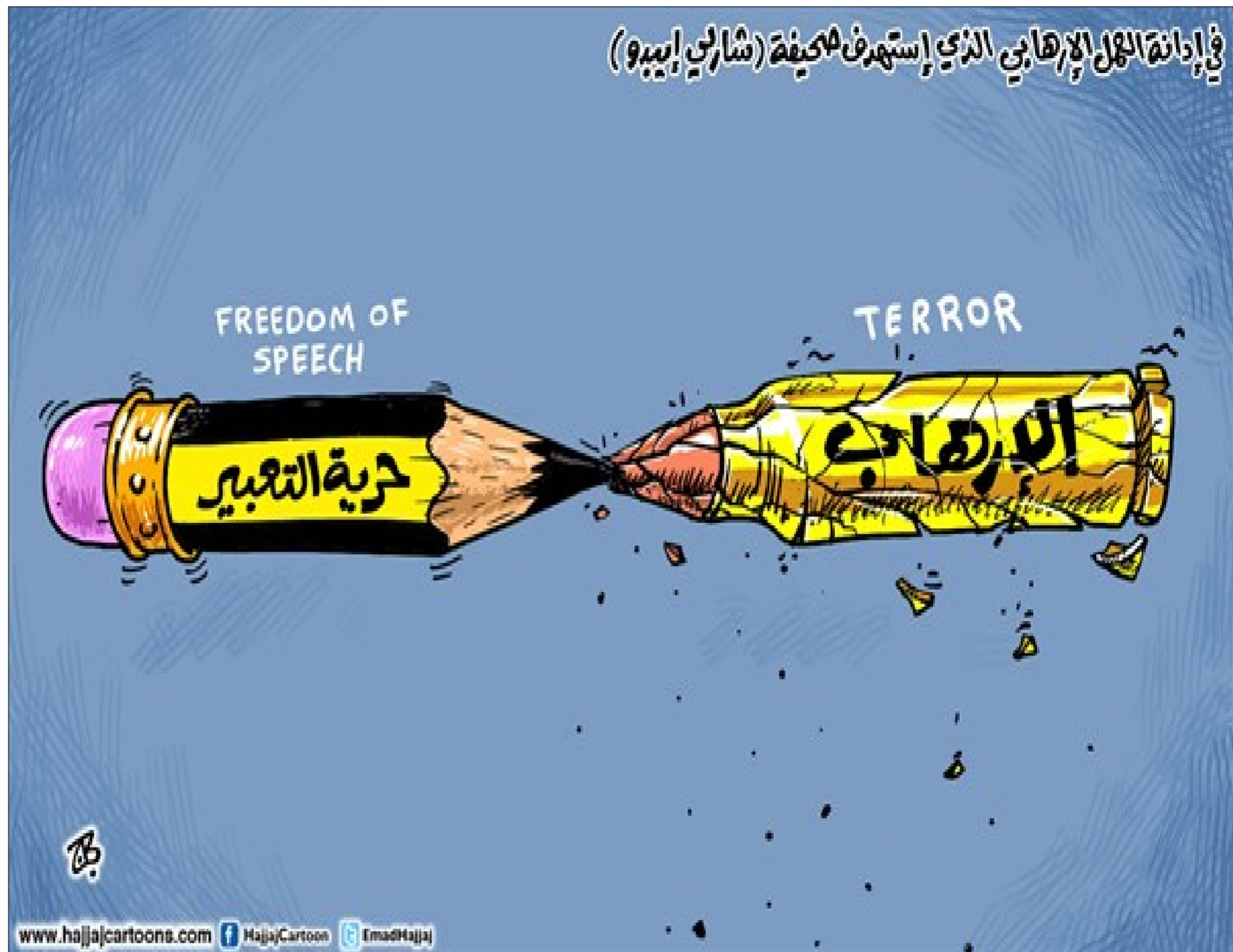
موقع «كارتون سياسي»