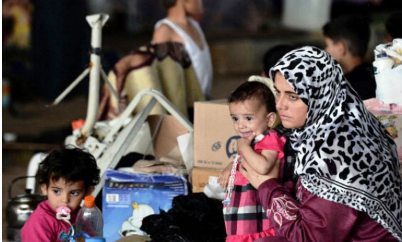
مشهد لأحدى العائلات النازحة "ارشييف"

وبين زنكنة ان إدارة المجمع تابع سير العمل بشكل مستمر وعن كذب كذلك متابعة الجهد الاتي الذي وفرته المحافظة لمجمعات النازحين وتعمل للبلاد ونهارا من اجل تلبية احتياجات تلك الأسر مؤكدا ان الاعمال مستمرة في مجمع نبي الله يونس في منطقة النهروان لانجاز المشاريع الخدمية كافة خلال الهدى المقبلة من اجل توفير الخدمات الضرورية للنازحين والعمل على تقليل معاناتهم وتأمين العيش الكريم لهم .