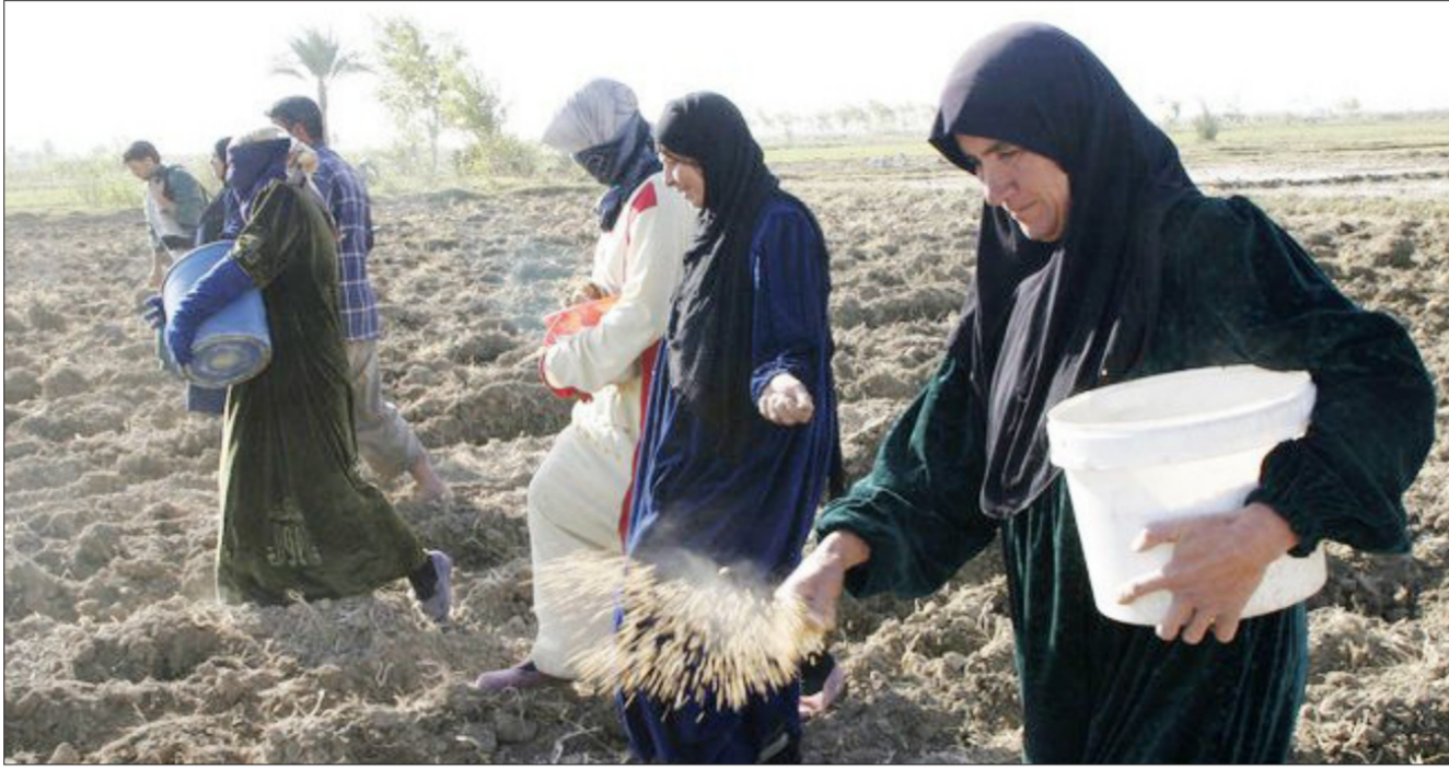
مشهد من الاعمال الزراعية في ديالى "ارشيف"

العسكرية الجارية الان في بعض مناطق ديالى".