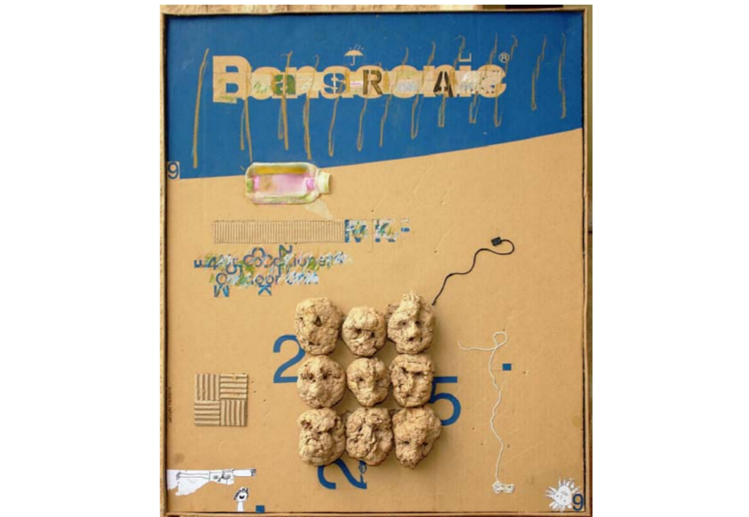
من أعمال الفنان هاشم تايه

تتناهى مناهات الموتى وغربة لثبه ووعيط الأسرار التي فقدت عذرتيها بين فراديس العظام (5) يا صديقي الغاية تخنّب خلف أخطاء النصور خفر هاماتهم تكدهن بصومعة الخلود وتعصف بها إلى قمصانهم الخائفة وتدهن الضوء بحشرانهم لنبيق الشهقة شائخة وتظلي وتظلي وتظلي تنشيتك مجاضي القروء! ..... (6) يا صديقي نخطئ حين نذهب إلى الأرض ترقص عند خط الانواء تنهدها عن قرب، عن بعد