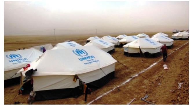
مخيم لنازحي كوباني