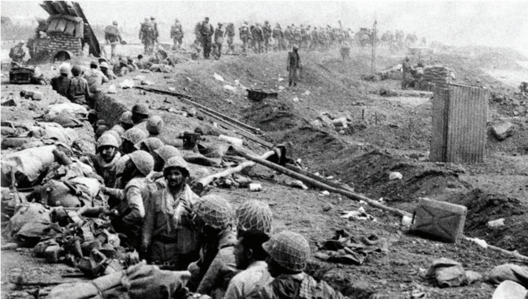
الحرب العراقية الإيرانية "رشيف"