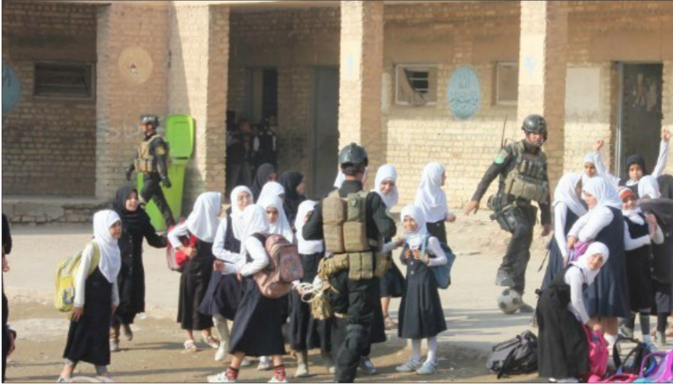
أحدى المدارس في ديالى "ارشيף"