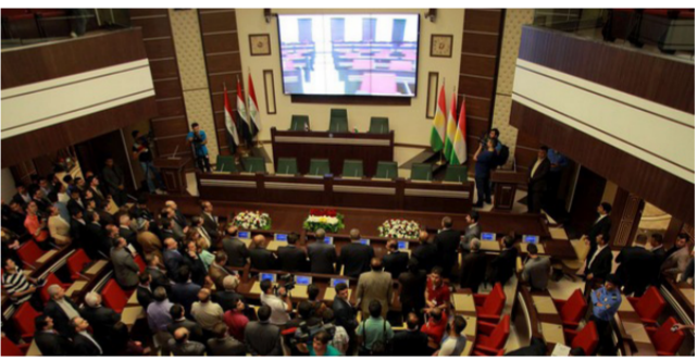
احدى جلسات برلمان الاقليم

الذي يبرلن اقليم كردستان العراق، العقد الذي تم بموجبه الاتفاق مع احدى الشركات الخاصة لشراء سيارات حديثة لأعضائه، بشكل رسمي ومن دون اية تبعات قانونية او مالية.