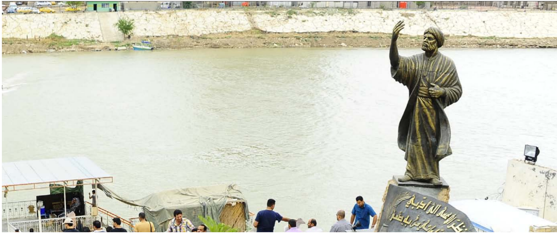
تمثال المتنبي (عسمة الصباح الجديد)

شهد المتنبي، شارع الثقافة والفكر، أمس الجمعة، مجموعة فعاليات ثقافية وفنية متنوعة، أقيمت في أماكن شتى من هذا الشارع، وحرصت «الصباح الجديد» على أن تغطي هذه الفعاليات ليرى القارئ الجانب المشرق من العراق وضمن هذه الصفحة المخصصة لشارع المتنبي. وكانت الحصيلة هي: