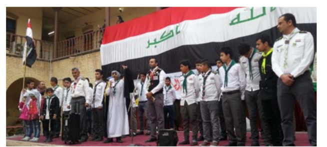
جانب من المهرجان