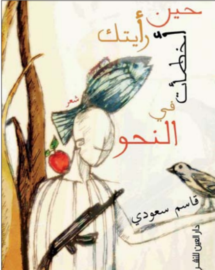
غلاف المجموعة الشعرية

وقاسم سعودي، شاعر وقاص عراقي، ولد في العام 1969، وحاصل على المركز الثالث في جائزة المشاركة للإبداع في أدب الطفل عن مجموعته القصصية «حكايات الدرهم الذي كان يغني»، صدرت له أربع مجموعات شعرية أولها كانت بعنوان «رثة نالفة» 2011 عن دار فضاءات للطباعة والنشر بعمان. ثم «ما لي يره الراكض» عن دار فضاءات أيضاً.