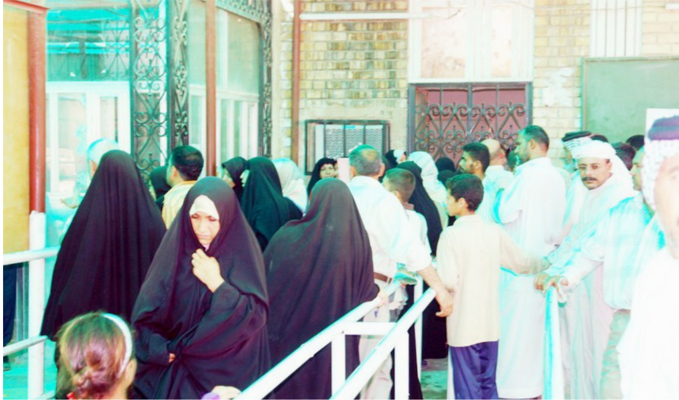
شبكة الحماية الاجتماعية «ارثيف»

قانون الضمان الاجتماعي المعد من قبل مكتب نائبه خضير الخزاعي. إلى مجلس النواب للتصويت عليه. عاداً أن إقراره سيؤدي بقائده كبيرة على شرائح كثيرة من المجتمع. ويحد من زخم طلبات التعيين في ضمان الأمومة وإصابات العمل للعمال في القطاع الخاص والمحتلط والتعاوني. والمتقاعدين مع القطاع العام.