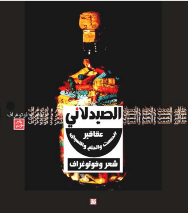
غلاف المجموعة الشعرية

هوامش: 1) الحرب والحرب والحضارة والموت: سيفهونه فريود. 2) المصرد نفسه. 3) الشعرية: تزيطن طودوروف.