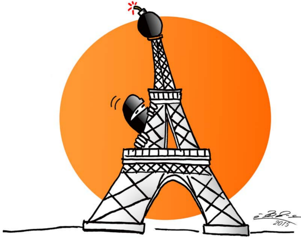
كاريكاتير - عاصم جهاد