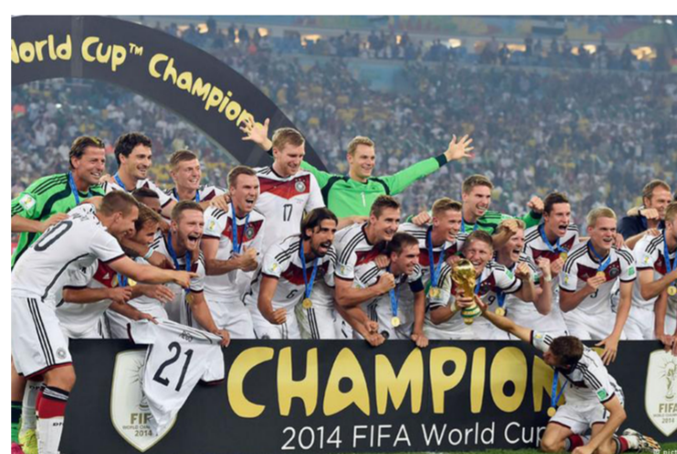
المنتخب الألماني يواصل صدارته عالميا

الترتيب الرابع عربيا والثمانين عالميا برصيد 393 نقطة. وفي باقي المراكز بالنسبة للمنتخبات العربية في التصنييف العالمي جاءت منتخبات ليبيا (78) والمغرب (82) وقطر (92) وسلطنة عمان (93) والأردن (94) والسعودية (102) والسودان (108) والبحرين (110) والعراق (114) وفلسطين (115) ولبنان (122) والكويت (125) وموريتانيا (138) وسوريا (151) وجزر القمر (173) واليمن (176) والصومال