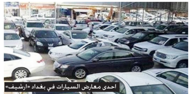
احدى معارض السيارات في بغداد «ارثيف»