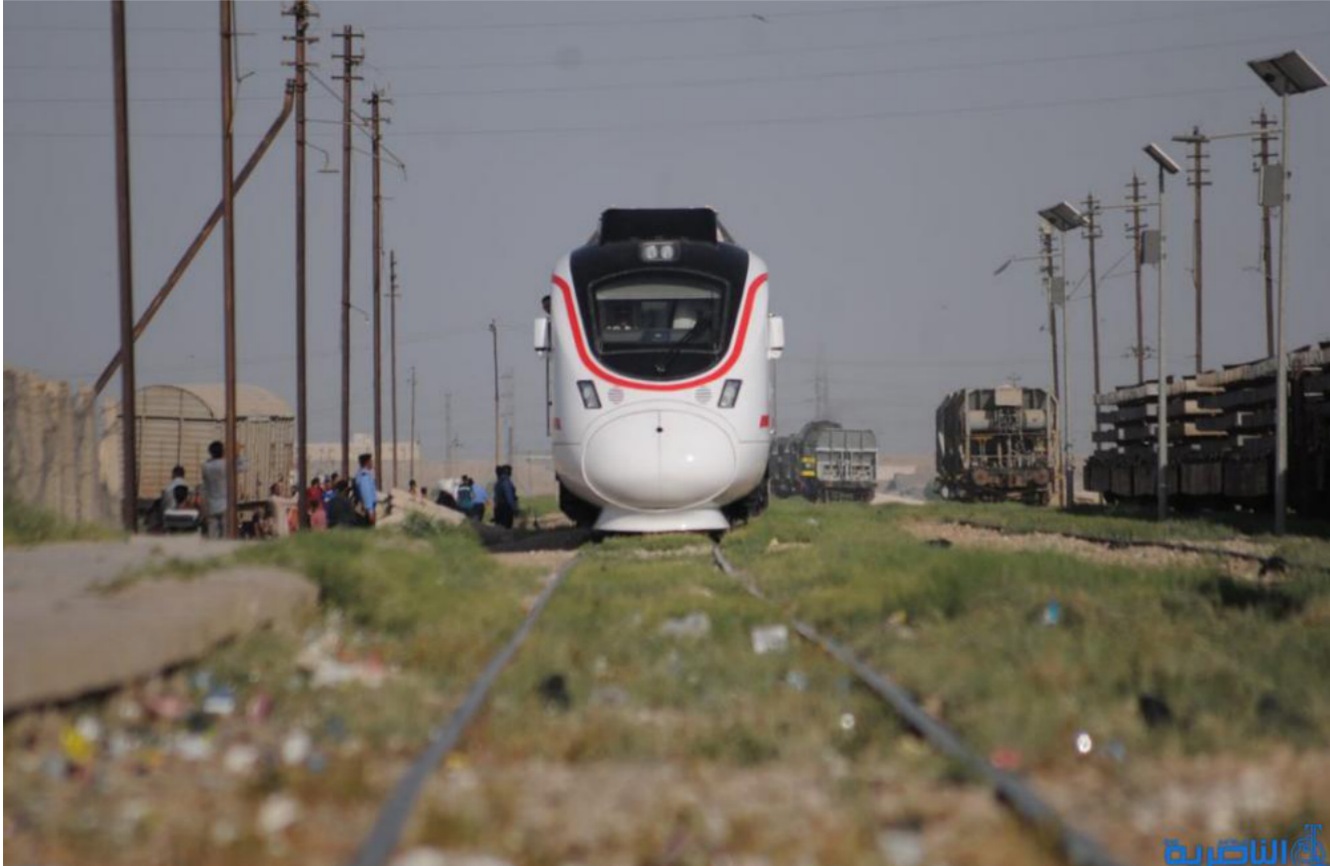
النقل تنتظر الدفعة الجديدة من القطارات الصينية

بعده ان نفذت مشاريع القرض الأول بنجاح وحازت على المرتبة الأولى بين المؤسسات التي استفادت من قروض شبيهة. وزاد الصافي ان وزارة النقل اتفقت مع وكالة جايبكا اليابانية على اعداد خطة مركزية لتطوير القطارات لغاية 2035. وكشفت عن ان وكالة جايبكا منحت مبلغ 390 مليون دولار لاجاز عدد من المشاريع لتطوير المسافرين على متن قطاراتها وسيتم تطبيقها خلال العام الحالي.