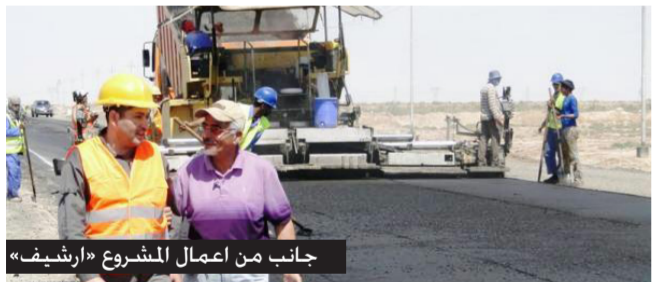
جانب من اعمال المشروع «ارثيف»