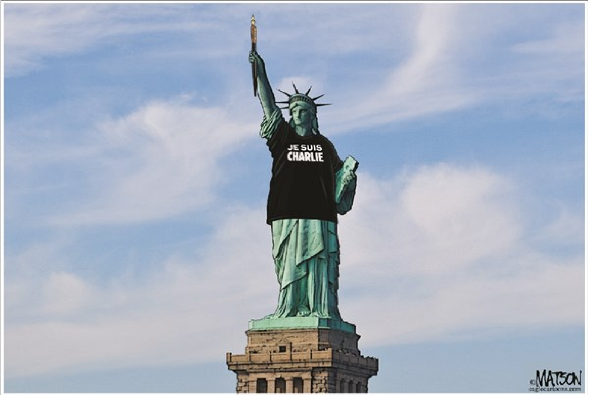
موقع «كارتون سياسي»