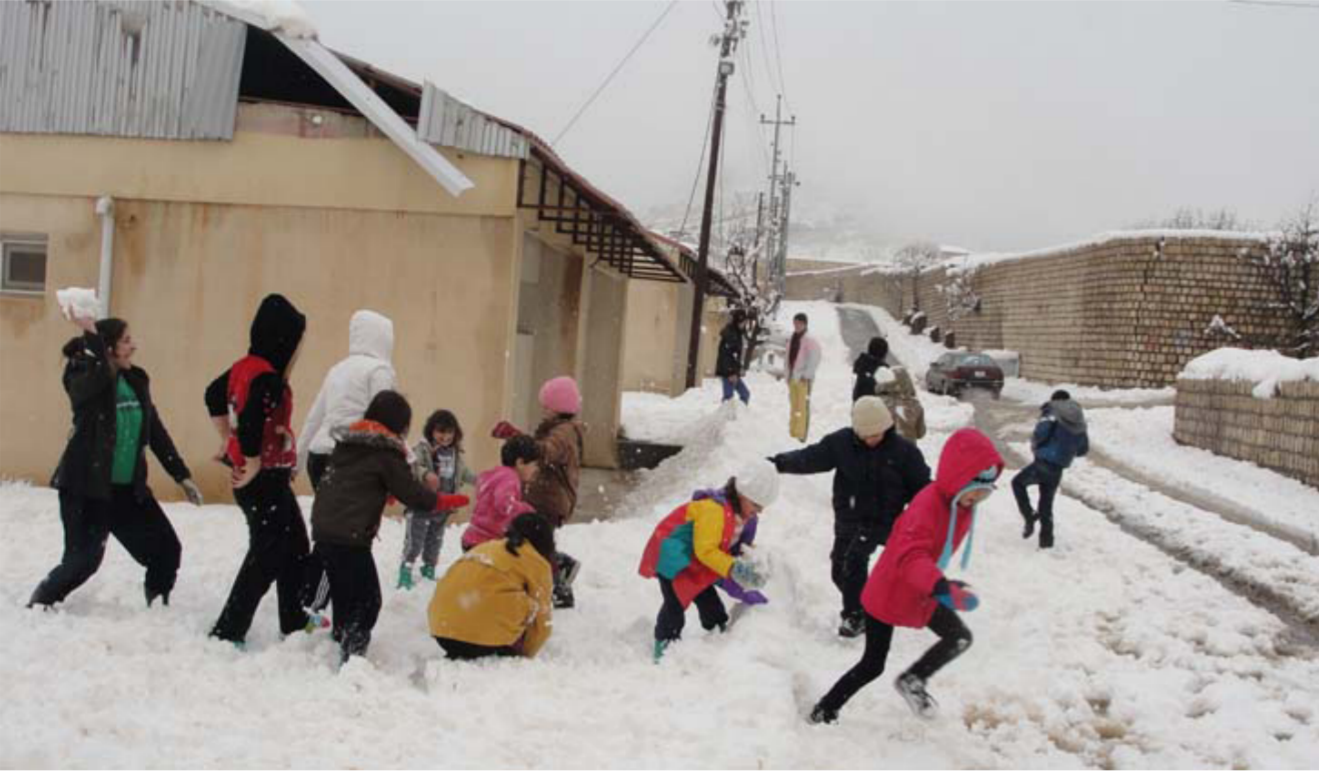
تساقط للثلوج على أحد الخيمات

إنسانية كردية قامت خلال الأسابيع القليلة المنصرمة بنصب أبواب وشبابيك في العشرات من الهياكل التي يشغلها نازحون من أجل مساعدتهم على مواجهة برد فصل الشتاء.