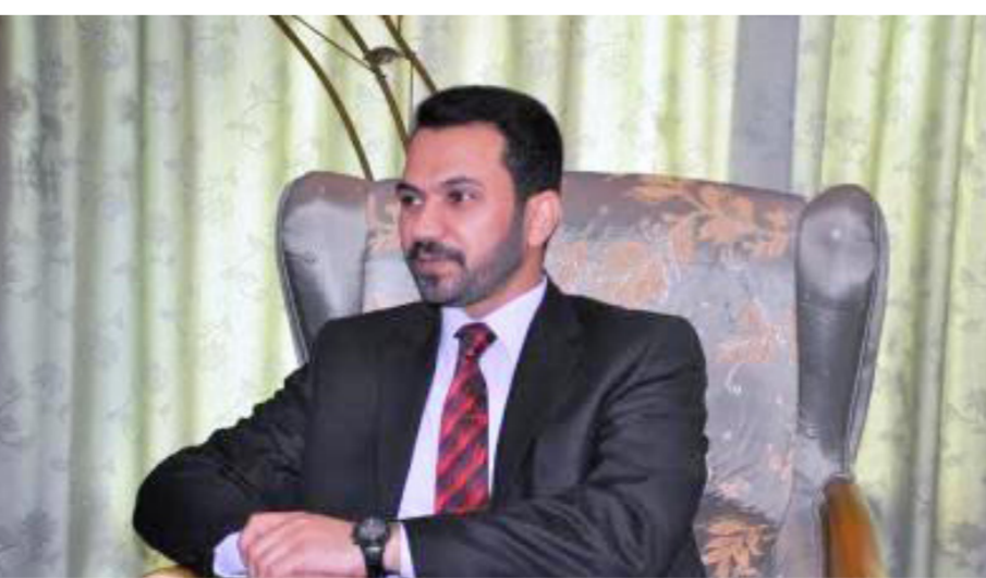
وزير الصناعة والمعادن الدكتور نصير العيساوي

ضرورة بذل الجهود الاستثنائية لاداء واجبهام الاعلامي بالنحو الصحيح وبما يتواءم ومتطلبات المرحلة المقبلة عن طريق الترويج للمنتجات المحلية وحث مؤسسات الدولة والقطاع الخاص على دعم الصناعة الوطنية واطلاق الدعوات والمطالبات لاقرار وتفعيل وتطبيق القوانين والتشريعات الداعمة للانتاج المحلي والزام الجهات المعنية بتنفيذها. من جهتهم أكد الحاضرون حرصهم الشديد و رغبتهم الصادقة في تقديم كل مايسعهم لدعم جهود الوزارة ومساعدتها الجادة والاسهام في تنفيذ الخطة الاستراتيجية الجديدة التي تبنتها الوزارة لدفع عجلة الصناعة الى الامام .