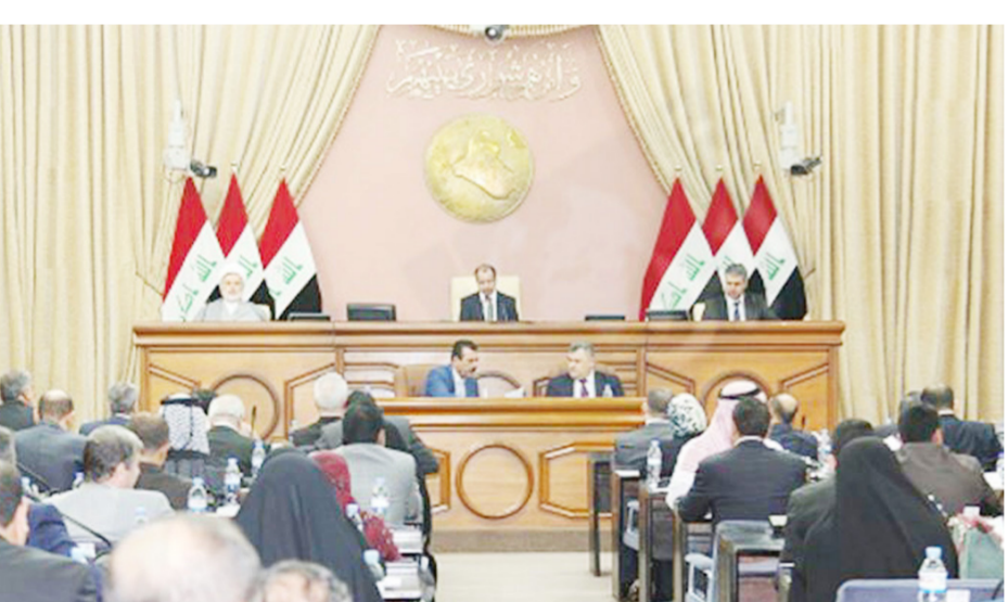
مجلس النواب "ارشييف"

حول الموازنة وأقرارها متروك للاتفاق السياسي بين الكتل في مجلس النواب".