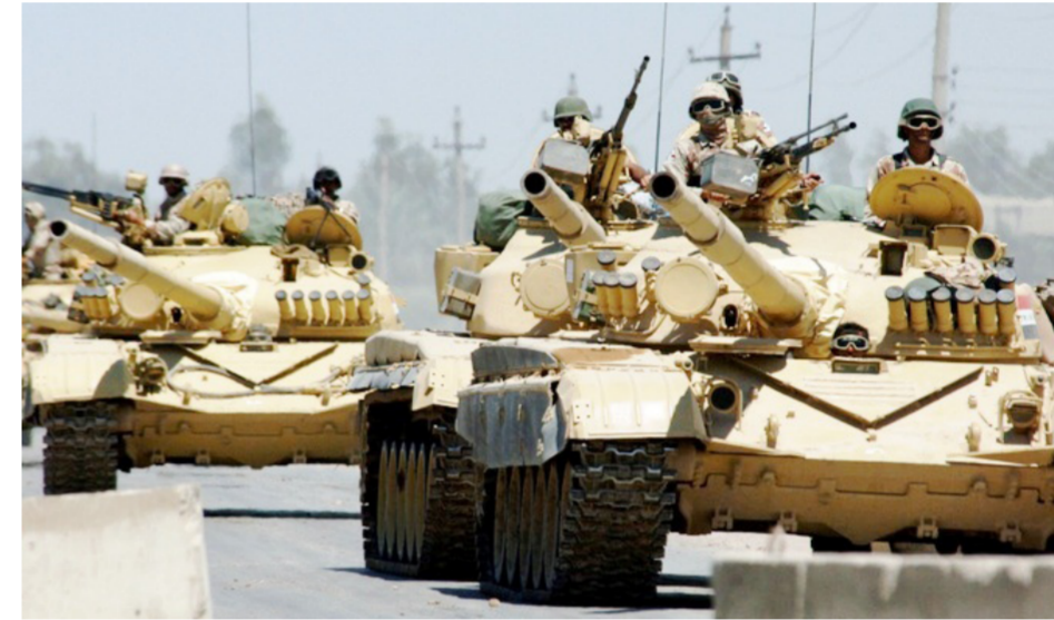
جانب من استعدادات القوات الأمنية "ارشييف"

"القيادات العسكرية تضع الخطط المناسبة لاقترام المعركة". كشفت أن "معركة تحرير المدينة ستبدأ بحلول آذار المقبل". وأفاد بـ "بوجود تنسيق مع الجانب الكردي. وقد عقدت نهاية الأسبوع الماضي سلسلة من اللقاءات مع وزيرى البيشمركة وداخلية الاقليم لاكمال الاستعدادات".