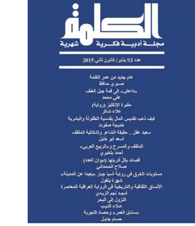
غلاف مجلة الكلمة