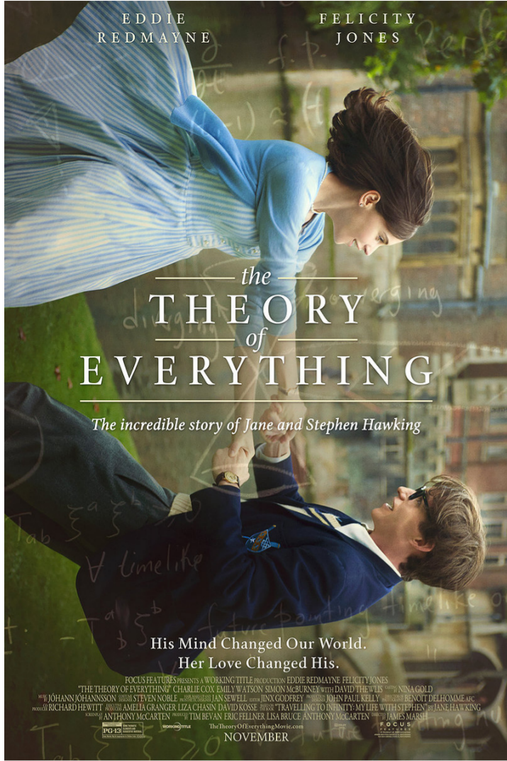
الملصق الدعائي للفيلم

علمياً عن حياة هذا العبقري ويبدو انه جُح في إيصال قصة الحُب وجمع العديد من الأحداث الدرامية في فيلم واحد. في الواقع كان من أهم أسباب نجاح الفيلم هي تلك القدرة الكبيرة التي أبدتها الممثل "إيدي ريدماين" في أداء دور ستيفن حيث صور مارش باللفظات القريبة حركات وجهه وسياقيه ومكابداته عند الكتابة وخصوصاً عند فقدان صوته نهائياً وقبل تركيب الآلة الصوتية. ليُقدم أداء مدهشاً إضافة لما قدمته الممثلة البارعة فيليستي جونز وهي تؤدي دور الزوجة "جين". وقد صرح إيدي ريدمان بشأن مشاركته بالداء "لقد كان مشروعا مليئاً بالعواطف بالنسبة للجميع. عائلة هوكينغ عاملتنا بكل لطف وأرادت أن تكون منصفين وأن تظهر روح الحيوية والدعابة بين ستيفن وجين". في الواقع الفيلم اهتم بتلك العلاقة المثالية بين زوج وزوجته لتحقيق هدف مشترك كبير وهو نوع من التحدي للعوق الفيزيولوجي من أجل انتصار العلاقة الروحية بتوافقها مع العقل لعبور المستحيل.