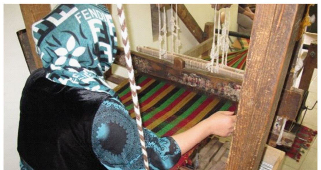
صناعة السجاد المحلي في الاقليم

جولتنا بالأسواق ومتاجر بيع السجاد، حيث اكتشفنا توقف جميع العاملين الحكومية عن العمل. ورغم بحثنا عن حرفي واحد أو مهتم بصناعة السجاد، فإن محاولتنا باءت بالفشل. ويعد السجاد أحد أهم الملامح التراثية في إقليم كردستان، وأخذ أثماناً وأشكالاً متعددة عبر الزمن، وأدخل الحرفيون عليه إضافات معاصرة من خلال الآلات بسيطة، وتنتشر محلات السجاد والفروش بمحافظات الإقليم، ولها زبائن محليون وأجانب، ولكن حجم الإقبال عليه انخفض بعض الشيء مؤخراً لأسباب وعوامل متعددة، منها وفرة السجاد الصناعي المستورد من الأسواق الأجنبية وخاصة الإيرانية والتركية والماليزية.