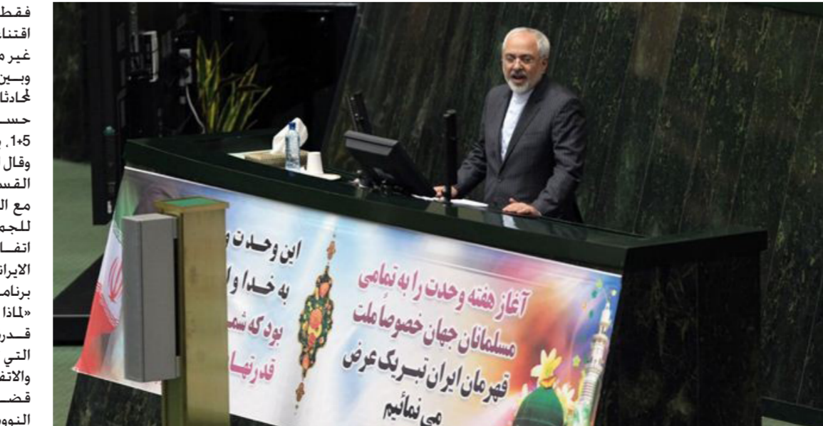
ظريف خلال دفاعه عن قيادة المباحثات أمس الثلاثاء في البرلمان الإيراني

البراني بقوة. وبحاول الطرفان التوصل الى اتفاق نهائي بحلول تموز 2015. لكن ظريف رأى ان المفاوضات «غير مبررة». وبين الانتقادات انعقاد جلسات عدة محادثات ثنائية مع الولايات المتحدة على حساب الأعضاء الآخرين في مجموعة 1+5. بحسب قدوسي. وقال ان الفريق الذي يقوده ظريف «امضى القسم الأكبر من وقته في التفاوض مع الولايات المتحدة». العدو التاريخي للجمهورية الاسلامية في إيران. منتقدا اتفاق جنيف الذي «لا يحترم الحقوق الإيرانية ويهدد على المدى الطويل» برنامجها النووي المثير للجدل. وسأل «ماذا تخليتم عن جنيف عن قسم من قدرة إيران وتخليتم عن الأوراق الراجعة التي تملكها الأمة خلال المفاوضات؟» والاتفاق الموقع في تشرين الثاني 2013 قضى بتجميد قسم من الأنشطة النووية الإيرانية التي يشتبه في انها تخفي شفا عسكريا مقابل رفع جزئي للعقوبات الغربية التي تضرب الاقتصاد