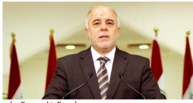
رئيس الوزراء حيدر العبادي

وقدم العبادي شكره لـ"كل من وقف معنا في حربنا ضد التنظيمات الإرهابية". مشيراً إلى أن "العراق الدولة الوحيدة التي تقاوم داعش والبعث والتنظيمات الإرهابية الأخرى على الأرض". وثمن رئيس الوزراء "دور العلماء والخطباء والإعلاميين والكتاب والمتقنين والفنانين وكل من ساند قواتنا الأمنية ووقف معها ضد التنظيمات الإرهابية".