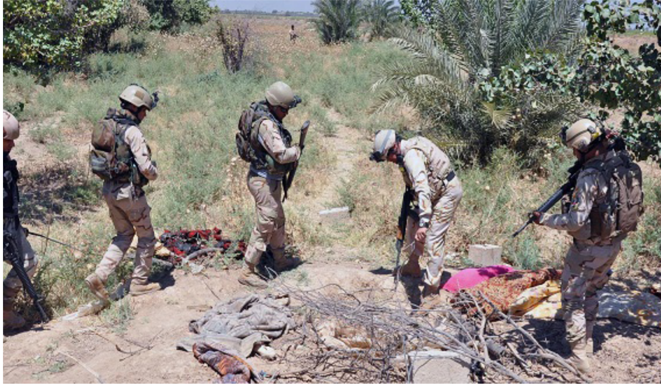
عناصر من الجيش العراقي في ناحية الاسحافي

تنظيم «داعش» أي منفذ للهروب. خصوصاً بعد خرب مناطق العوجة وقرية عوينات. مع الأخذ بالحسبان للتواجد المكثف لعناصر الجيش العراقي في منطقة وادي شيشين. ويؤكد مراقبون أن الأجهزة الأمنية العراقية حكمت قبضتها على مركز مدينة تكريت وخاض تنظيم «داعش». لكن ناحية العلم شرق مدينة تكريت والصينية التي خدما من جهة الشمال تغصن خد الآن تحت سيطرة التنظيم المسلح الذي زحف باتجاه تلك الناحيتين بعد خرب قضاء بجي شمالي تكريت.