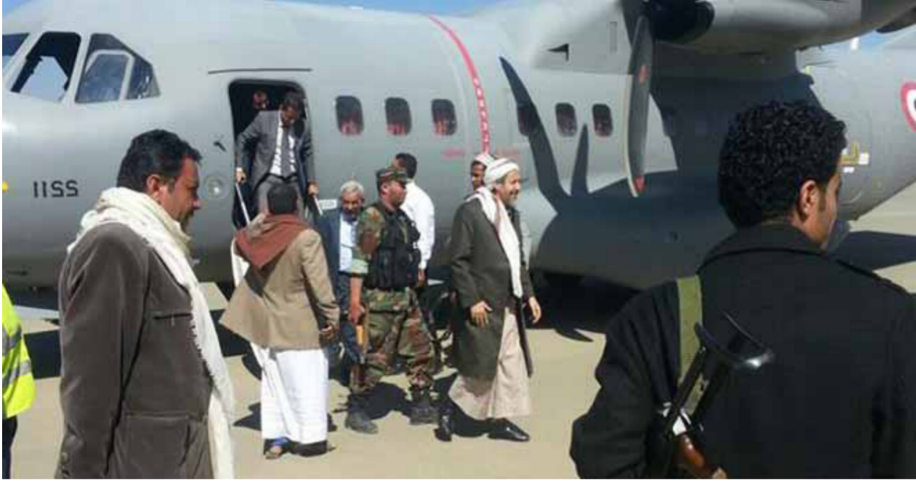
مستشارو الرئيس اليمني يصلون صعدة للقاء الحوثيين

كبير في شل الحركة وأغلقت جميع المحلات التجارية في أنحاء مديريات خور مكسر والمنصورة والشيوخ عثمان ودار سعد والملا والنواهي وكريتر. مشيراً إلى أن البنوك الحكومية والأهلية والشركات العامة والخاصة أغلقت تماماً فيما شلت حركة النقل والمواصلات. وأكد الفعطي أن «العصيان الذي ينفذه أنصارنا في الحراك الجنوبي كل يوم اثنين هو أحد وسائل النضال السلمي لشعبنا من أجل التحرير والاستقلال واستعادة دولتنا» على حد قوله.