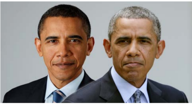
الشيب يغزو رأس اوباما

حلافه الخاص اضطر إلى تكذيب الشائعات التي اتهمته بصبح شعر الرئيس بخصلات بيضاء؛ بقية أن يظهر للعالم أنه رجل دولة بامتياز. وقد استخدم العلماء برنامجاً على الكمبيوتر يعطي العمر التقريبي لأوباما. مستنداً إلى مجموعة هائلة من الصور الفوتوغرافية له. وتوصل "أوشينسكي" إلى أنه بعد دراسة خلية للرؤساء الأميركيين الذين ماتوا جزاء عوامل طبيعية، مستنفا منهم أربعة رؤساء تم اغتيالهم، فإن الرؤساء الأميركيين يشيخون أسرع مرتين من الرجال الاعتياديين. إلا أنهم يعيشون مدة أطول؛ بسبب التأمينات الصحية.