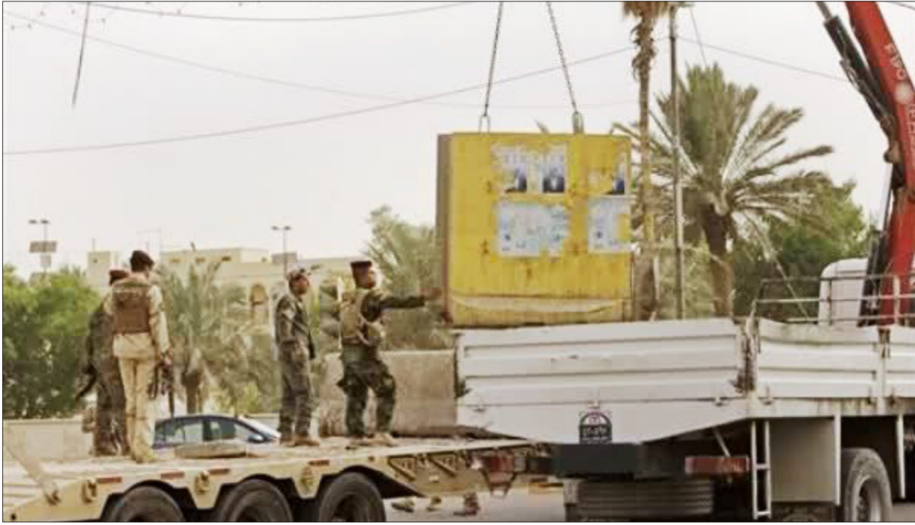
جانب من اعمال رفع الكتل الكونكريتية في بغداد "رشيف"