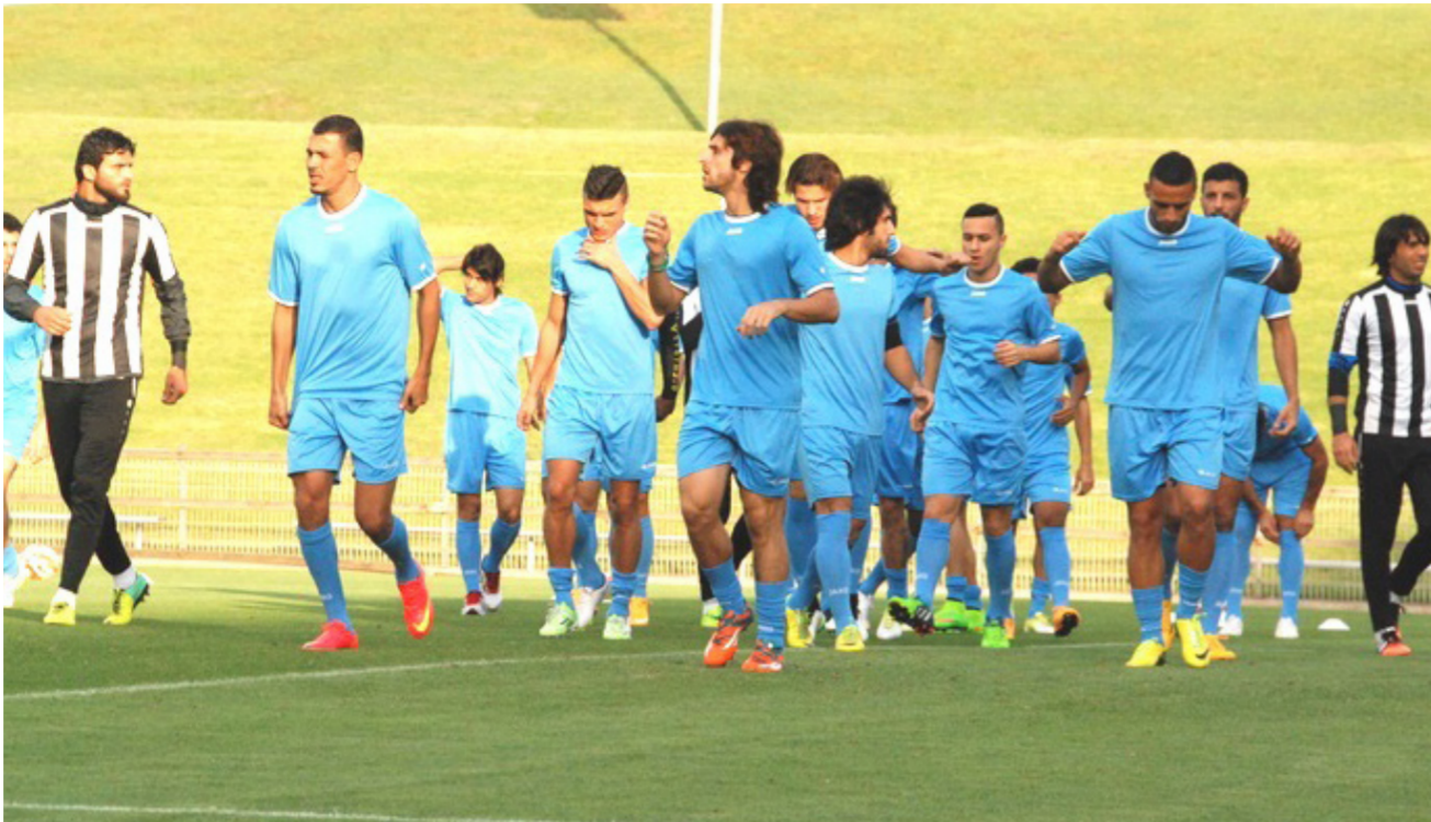
جانب من تدريبات المنتخب الوطني في أستراليا

واضاف ريكز سيتم تجهيز الإعلاميين بتذاكر المباريات من المركز نفسه مشيرا الى ان هذه التذاكر ستكون جاهزة اعتبارا من يوم الجمعة وكذلك تم توفير الحاسبات مع الإنترنت لأكثر من 250 إعلامي وفوتوغرافي. وتابع ان الخدمات الإعلامية التي تم توفيرها للإعلاميين تعد هي الأفضل على مدار الطولات مؤمدا لن يفقد الصحفي أي شيء وبالنسبة لواجبات الإعلاميين وعلى الرغم من انتهاء الفترة المحددة لها إلا أننا مازلنا نعمل على إصدارها لبعض الإعلاميين الذين حضروا بشكل متاخر.