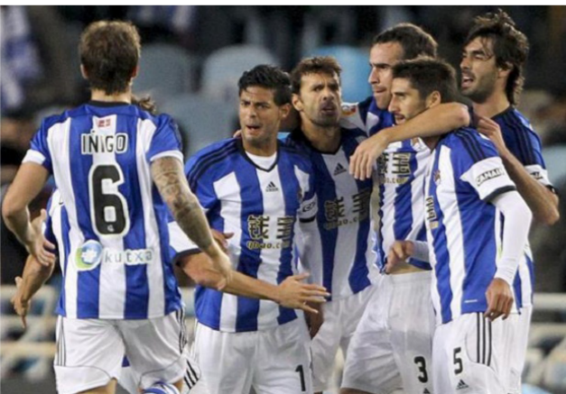
سوسبيداد.. يحرم برشلونة من صدارة الليجا

والأمعاء الدقيقة. في حين يتذوق مدرب ريال سوسبيداد الإسباني. الاسكتلندي ديفيد مويس طعم النجاح عقب شهر ونصف على وصوله لقيادة النادي الباسكي وبعد فوزه على برشلونة بهدف نظيف. إذ لم يخسر الفريق حت قيادته سوى في مباراة واحدة من أصل سبع. وكان سوسبيداد فاز بعد ان سجل جوردي ألبا هدفا في مرماه بطريق الخطأ بعد مرور 82 ثانية فقط على بداية اللقاء.