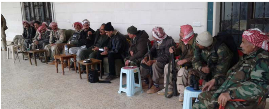
مقاتلون إيزيديون في سنجان عدسة الصباح الجديد

وجبة الغداء في المزار والتي اقتصرت على البرغل والبصل النيء ومضاف اليه شيئا من مسحوق السماق. عقب مغادرتنا للمزار بخمسة ايام. شن تنظيم داعش هجوما على مزار شرف دين بشاحنة مفخخة بتقدمها هم 10 امتار تقريبا فمقره وقتل من فيه. فترجع بقية الرتل وفروا هاربين».