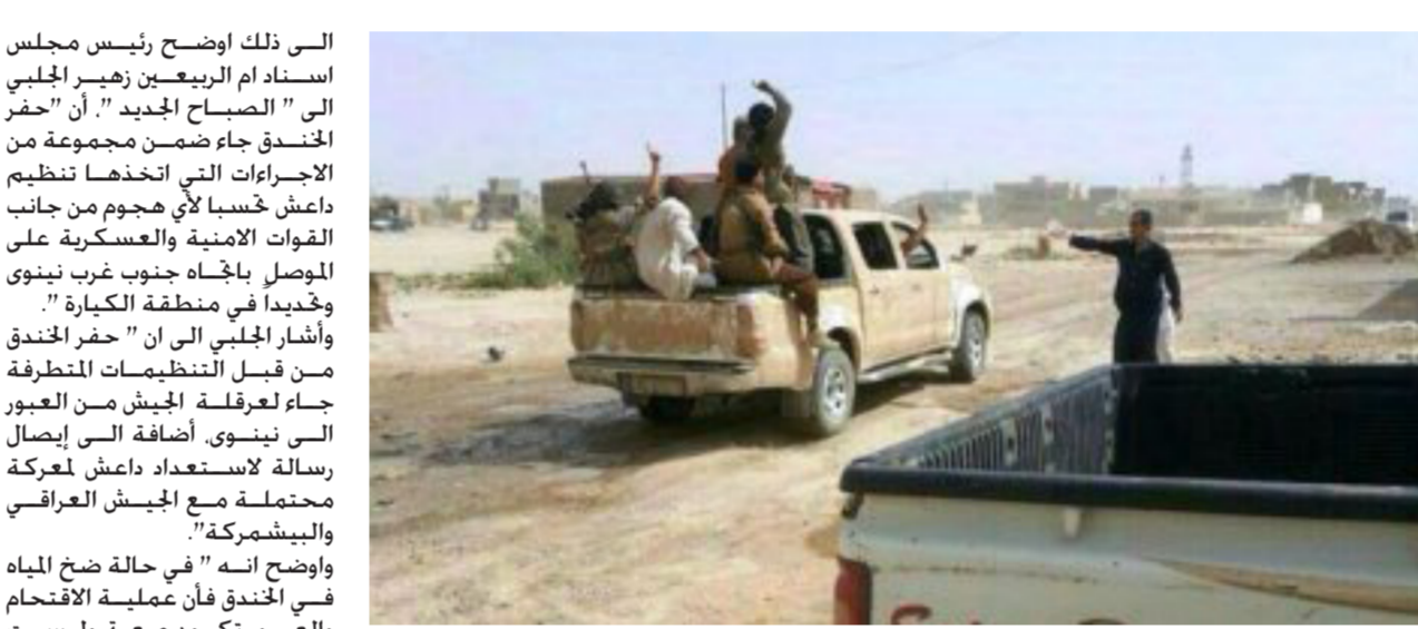
عناصر تنظيم داعش في الموصل