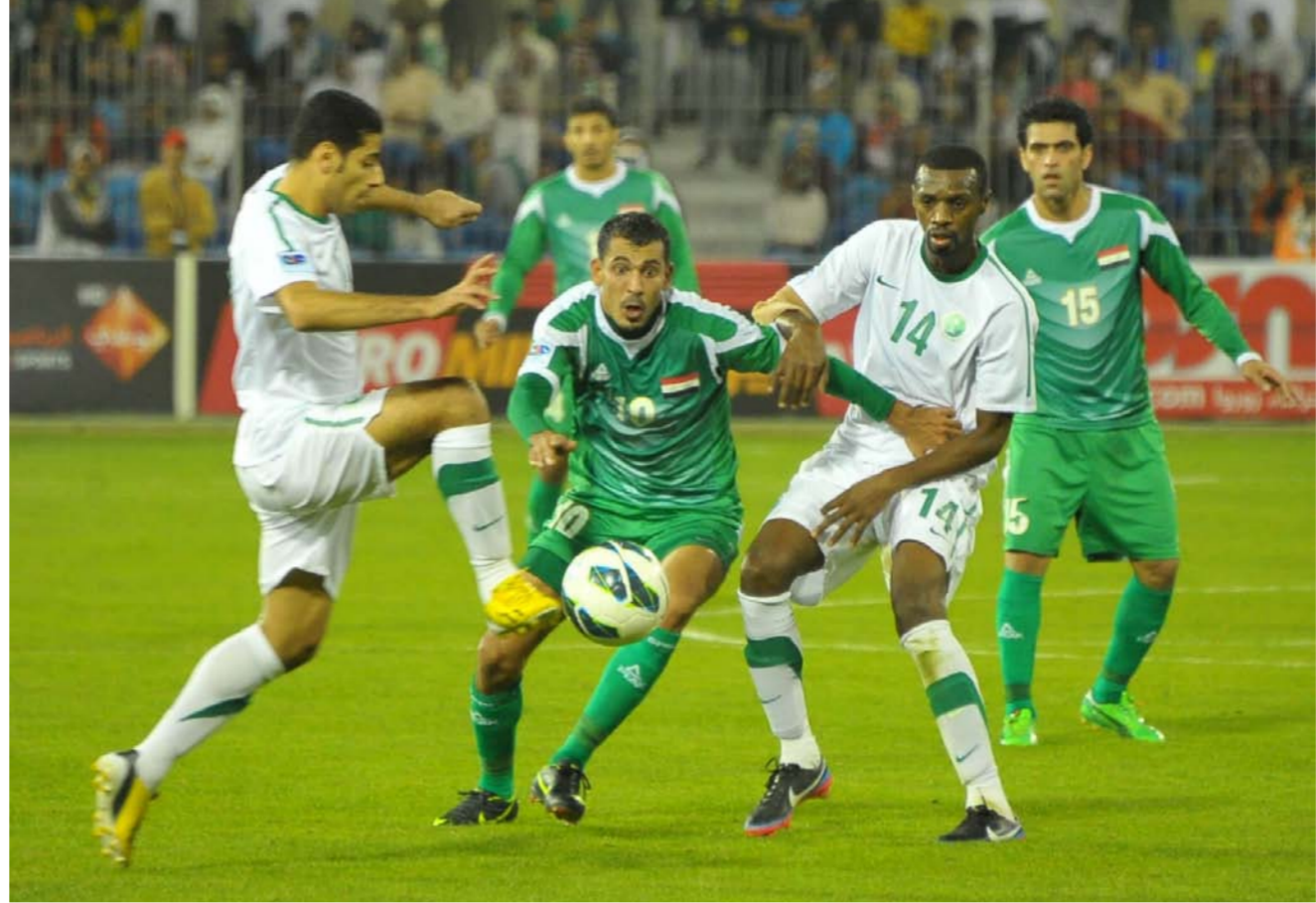
صورة جانب من إحدى مباريات المنتخب الوطني "أرشيف"