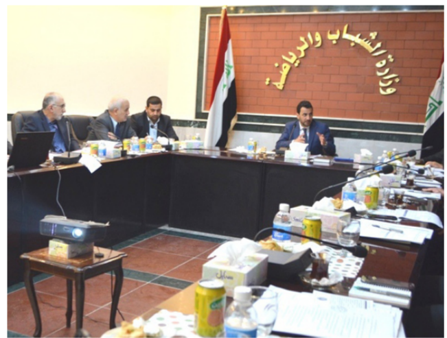
جانب من اجتماع هيئة الرأي

وبحثت هيئة الرأي ايجاد خطط بديلة لدعم الأنشطة الشبابية والبرامج الرياضية التي تقيمها الوزارة بعد قرار الحكومة بتقليص النفقات بسبب تراجع اسعار النفط وتأثيره على الموازنة العامة للدولة.