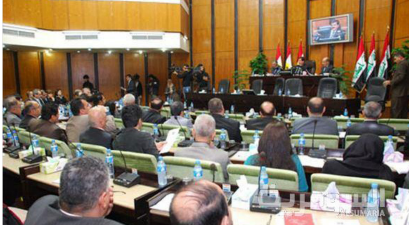
برلمان إقليم كردستان في جلسة سابقة (ارشيف)

وأخيراً مشروعاً قانون الرعاية الزراعية، وقانون عدم قطع رواتب الوحيدين.