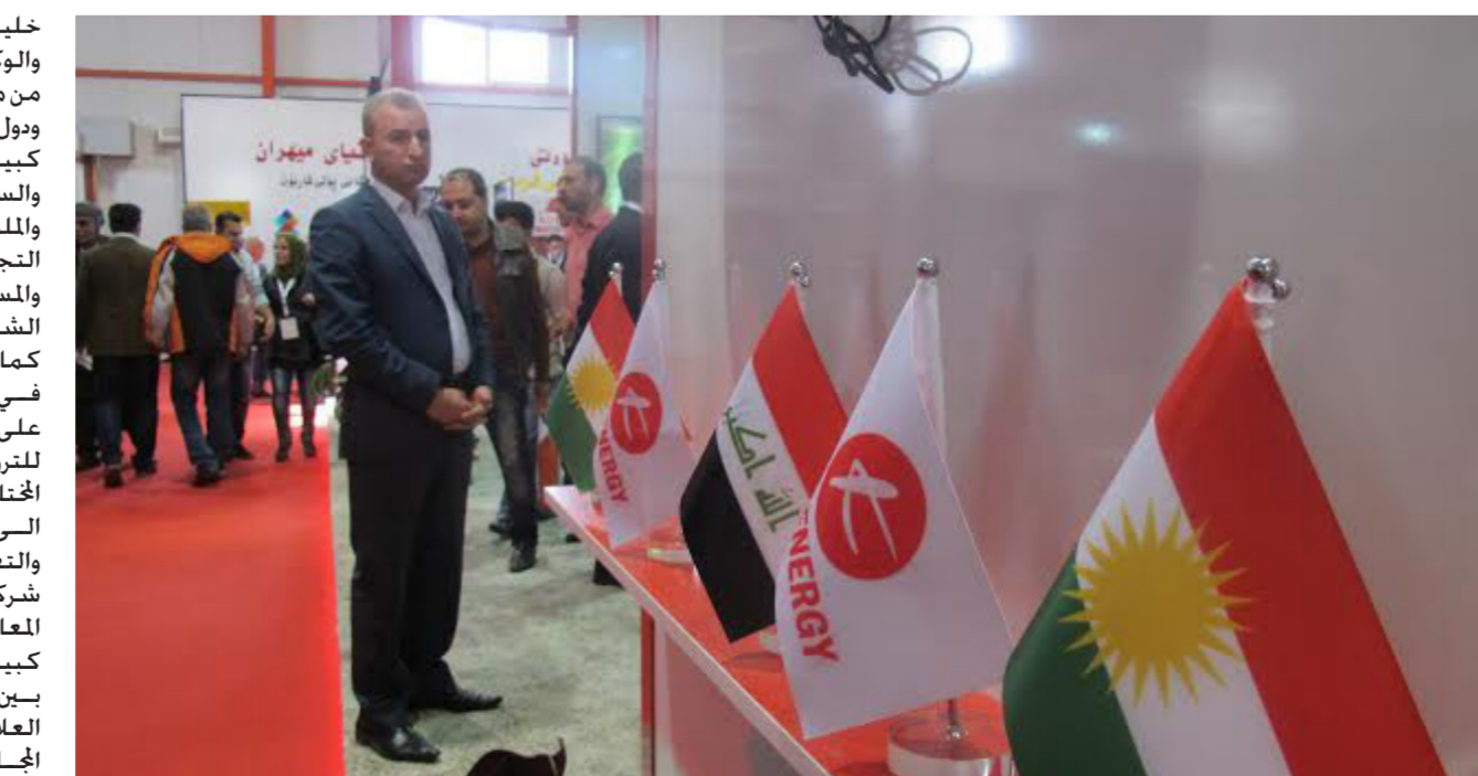
من أجواء المعرض

خيلطا من التجار والصناعيين والكلاء والموزعين رجال الأعمال من مختلف القطاعات التي جمع ودول الجوار إضافة الى جمع كبير من وزراء التجارة الدوليين والسفراء والديبلوماسيين والملحقين التجاريين والبعثات التجارية وغرف التجارة الدولية والمسؤولين الحكوميين وكبار الشخصيات .