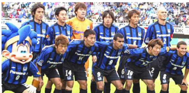
فريق جامبا اوساكا