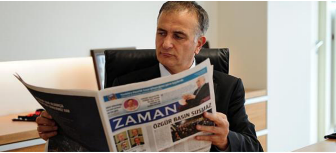
دومانلي رئيس تحرير جريدة زمان التركية

وقالت صحيفة حرييت إن الشرطة اعتقلت أكرم دومانلي، رئيس خبير «زمان»، وذلك بعد أن داهمت مقر الصحيفة للمرة الثانية يوم أمس الماضي، إلى استقالة ثلاثة وزراء، ودفع أردوغان إلى نقل آلاف من أفراد الشرطة ومئات القضاة والمدعين كما مرر تشريعات تزيد من سيطرة الحكومة على القضاء والمدعين، وخلال تلك الفترة أسقط الدعوى قضائيا الفساد.