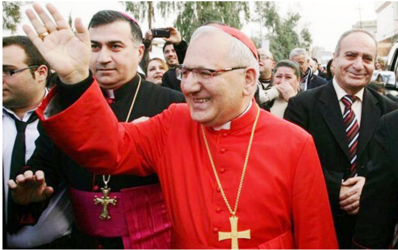
لويس رافائيل الأول ساكو في كركوك "رشيْف"

إدارة كركوك تعمل على تقديم الخدمات لجميع مكونات المدينة ضمن واجباتها وخاصة الاخوة المسيحيين لهم من دور ومكانة كريمة بين الكركوكيين، وقررنا ان يكون يوم الخامس والعشرين من الشهر الجاري عطلة رسمية في جميع دوائر محافظتنا تضامنا ومحبة للمسيحيين وللمشاركة باعيادهم وتعبيرا عن فرحنا بهم