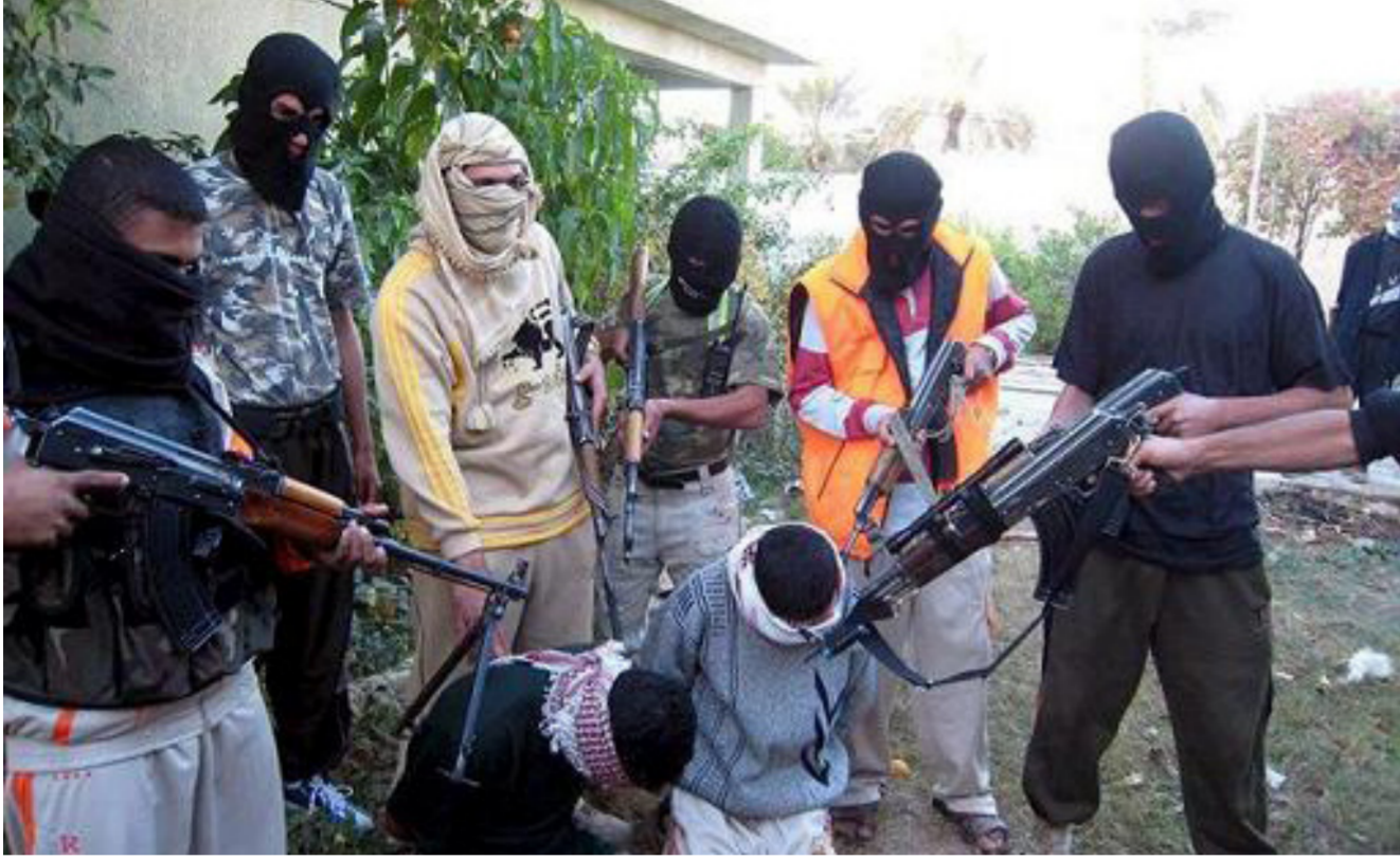
احدى العصابات في العراق

سببولة لتمويل الكثير من اعمال العنف اذا ما عرف بان حجم الاموال التي يجري استحصالها من ذوي الخطفين تصل في بعض الاحيان الى اكثر من 100 الف دولار امريكي. واضاف التميمي ان « محاولة البعض تبرير عمليات الخطف بانها ناجمة عن فعل لعصابات غير مرتبطة بالجماعات المسلحة امر غير صحيح والادلة على ذلك كثيرة من خلال رصد بعض حالات الخطف وسؤال الخطفين عن هوية من قام باختطافهم ما يظهر بان داعش وحلفائه تقف وراء النسبة الاعلى من الخطف لانها تدرک اهمية الملف باعتبار مورد مادي جيد بالنسبة لها».