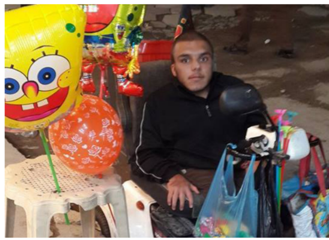
حب الناس أحد أسباب نجاحه