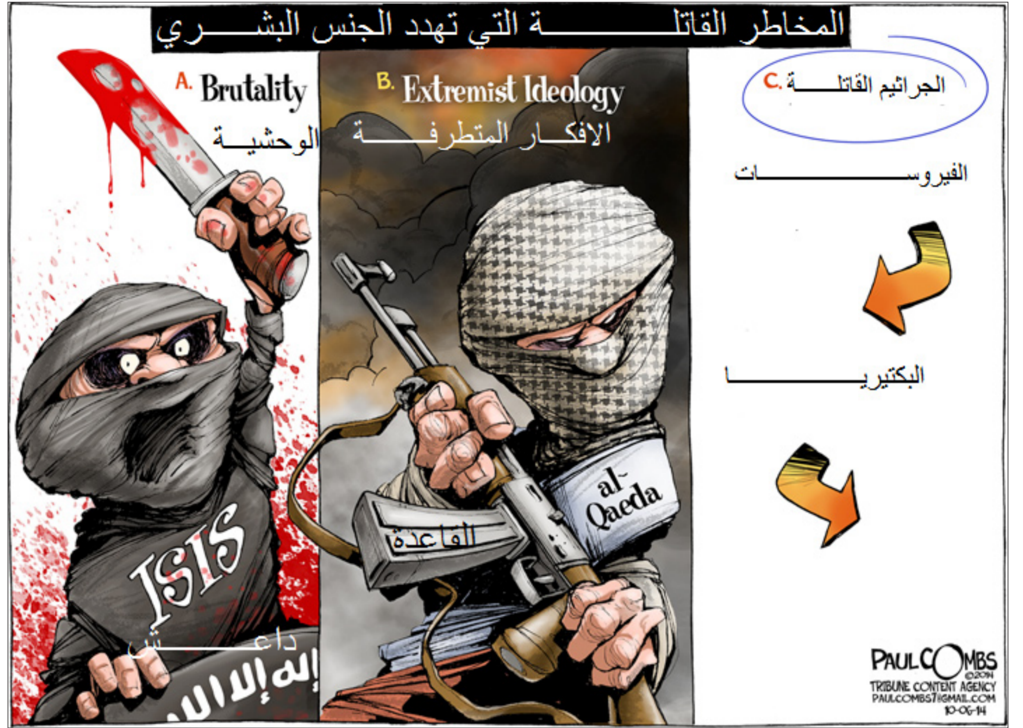
من بول كومبس