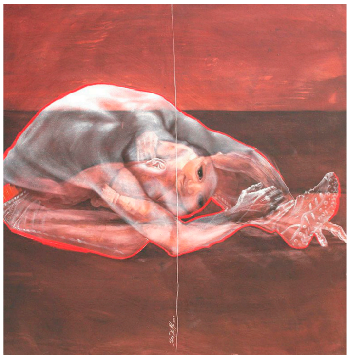
من أعمال سارة شمّء

ومع المحيط وعوالمه الغربية والمشوهة، عكس تلك الأعمال التي ابتدأت من خلالها مسيرتها الفنية بداية الألفية الثانية، حيث الميل إلى الهدوء والتأمل والانشغال على تقنيات الصورة والضوء والظل، حيث وظفت في أعمالها مفردات الفن البصري الأسر والتكنيك العالي في رسم الملامح والأجساد بتقنية واعية سحرية. لا تخلو من مفازيات سوربالية في بعض المشاهد، وخصوصاً في تصوير (البكارون) وفي بعض حركات الوجه.