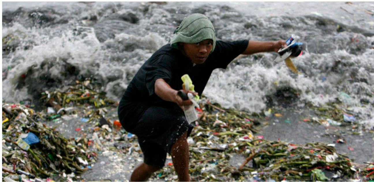
رجل يجمع البلاستيك من أحد السواحل

ويقول خبراء البيئة إن التلوث البلاستيكي موجود في جمعات حول محيطات العالم، وإن هذه الدراسة تقدم تقديراً أكثر وضوحاً لكمية القمامة، التي