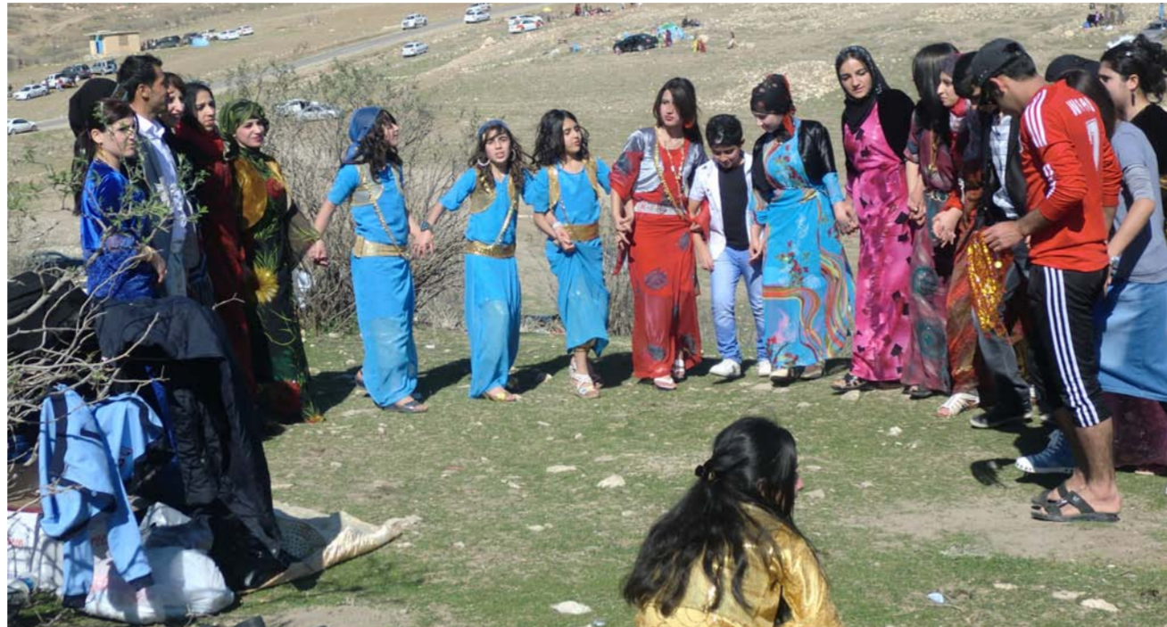
جانب من احتفاليات الأقليات في إقليم كردستان "أرشيف"