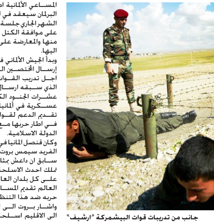
جانب من تدريبات قوات البيشمركة "أرشيف"

المساعي الألمانية اضافت المصادر ان البرلمان سيعقد في السابع عشر من الشهر الجاري جلسة خاصة للحصول على موافقة الكتل النيابية الحاكمة منها والمعارضة على المساعي المشار اليها. وبدا الجيش الألماني في اكتوبر الماضي إرسال المختصين الى كردستان من اجل تدريب القوات الكردية الامر الذي سبقه ارسال العتاد وتدريب عشرات الجنود الكرذ في مواقع عسكرية في ألمانيا وذلك في إطار تقديم الدعم لقوات البيشمركة في إطار حربها مع مقاتلي تنظيم الدولة الاسلامية. وكان فنصل المانيا في إقليم كردستان الفريد سيمس بروت قد ذكر في وقت سابق ان داعش بمثابة دولة اريابية تملك أحدث الاسلحة وبشكل خطرا على كل بلدان العالم لذا فان على العالم تقديم المساعدة للاقليم في حربه ضد هذا التنظيم. واشار بروت الى ان بلاده ترسل الى الاقليم اسلحة وعتادا وذخائر