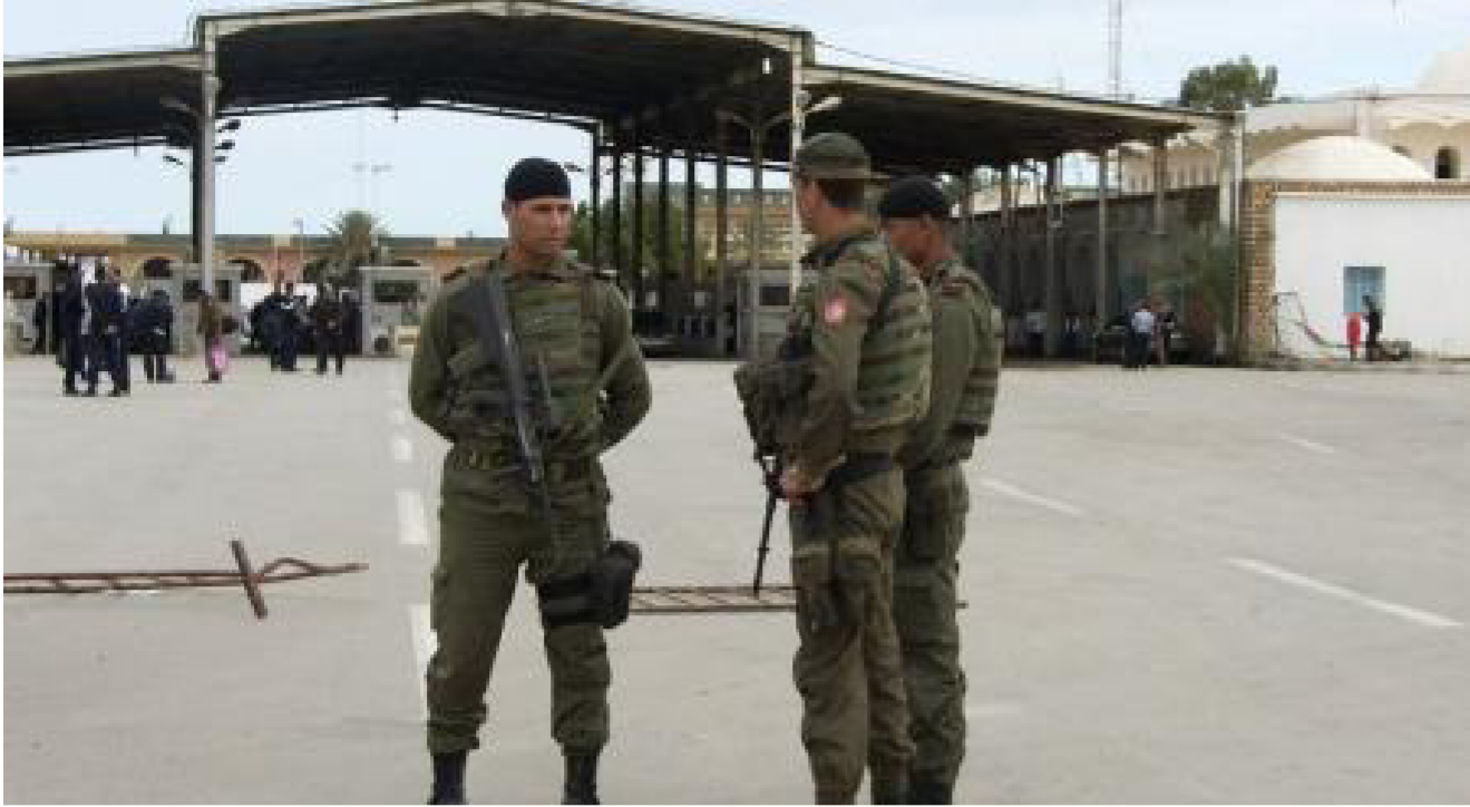
جنود تونسيون يحرسون معبر رأس جدير على الحدود مع ليبيا

إن طائراته أغارت على مواقع قرب سرت وهي مدينة ساحلية بوسط ليبيا وهو الأمر الذي أكده مقيمون. وتابع أن فصيلا من مصراثة وهي مدينة ساحلية غربي سرت والميناءين تقدم صوب رأس لانوف والسدرة بعدد كبير من المركبات. ويستخدم الصراع في ليبيا العضو في أوليك بين حكومتين وبرلمانين منذ أن سيطرت جماعة تعرف باسم فجر ليبيا على العاصمة طرابلس في الصيف.