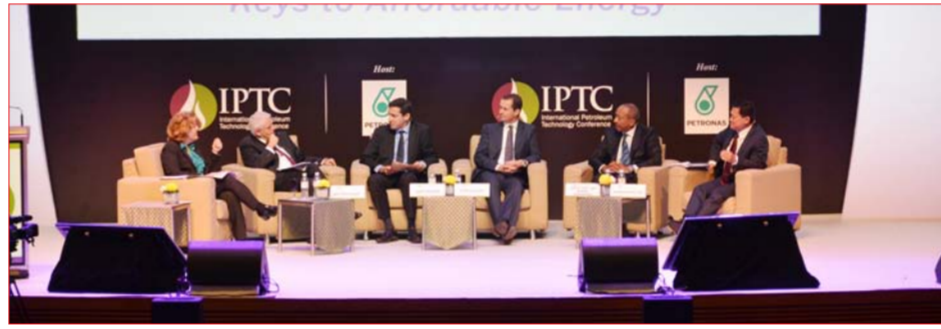
جانب من اعمال المؤتمر

التي أقيمت على هامش المؤتمر، أن "هذه الفعالية الاقتصادية المهمة تعد الأكبر إذا ما قورنت بالفعاليات الأخرى التي تتناول شؤون النفط والطاقة حيث يحظى هذا المؤتمر بحضور أكثر من 10 آلاف مشارك من دول العالم من بينهم وزراء النفط والطاقة والخبراء والأكاديميين والمعينين في شؤون النفط والطاقة فضلاً عن الشركات النفطية العالمية".