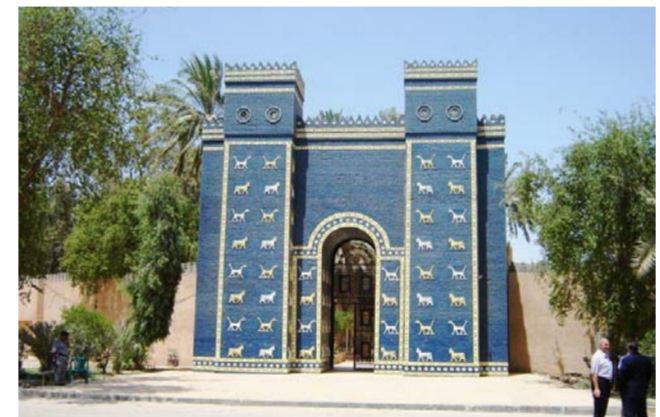
بوابة عشتار في بابل

وكان مجلس محافظة بابل أعلن في الثامن من الشهر الماضي عن تشكيل اربع لجان لاعداد دراسة علمية بشأن مشروع «بابل عاصمة العراق التاريخية» وارسالها الى رئاسة الوزراء للمصادقة عليها.