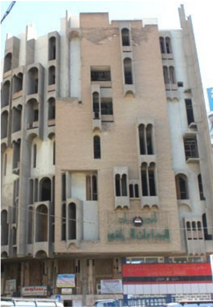
من أعماله ببغداد

عبر فصول خمسة، ونحن تأمل، هو نتاج خيرة جاورت نصف قرن من الاجاز المعماري ومؤلفات عدة ذات علاقة، يستوضح الجادرجي تصورا نظرياً، عابراً الأطروحة المعتادة في تناول موضوعة الجمال. بوصفه درسا فلسفياً يتجه الى التعاطي معه عبر رؤية تتمثله بوصفه معرفة وانجازاً مجتمعين وانسانيين بامتياز.