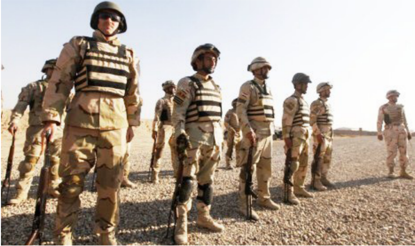
القوات الأمنية العراقية

له دور في مساندة القوات الامنية عبر صيغة قانونية واضحة تحدد مهام القوات وطريقة ادراتها». وجاءت فكرة انشاء الحرس الوطني ضمن بنود الورقة الوطنية التي قدمها التحالف الوطني الى الشركاء السياسيين كأساس لتشكيل حكومة العبادي. وحددت الورقة سقفاً زمنياً امده ثلاثة اشهر لتأسيس قوة رديفة للجيش والشرطة لها مهام محددة، ومستوى تجهيز محدد، وجعلها العمود الاساس في ادارة الملف الامني في المحافظات، وعمليات النقل بدأت بعد وصول فكرة تشكيل الحرس الوطني كحل لتوضي انتشار الاسلحة والتشكيلات العسكرية المتنوعة في البلاد.