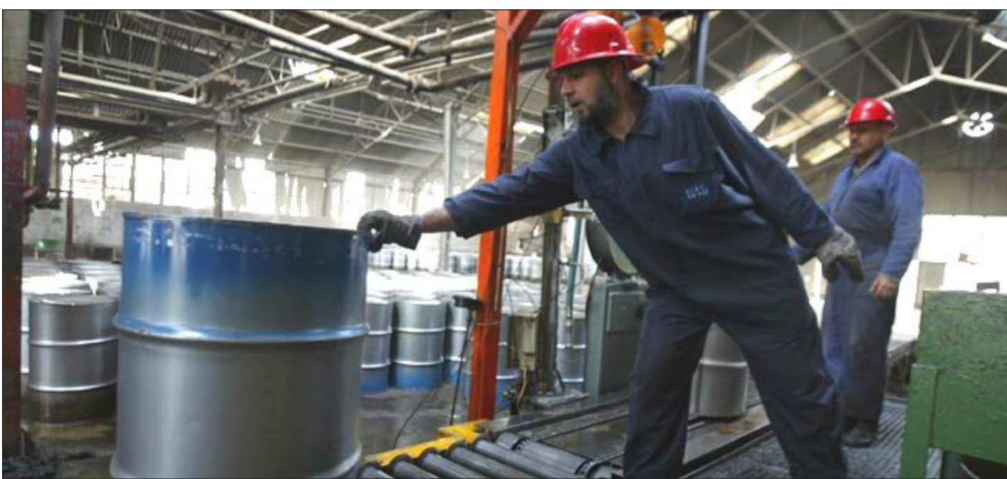
العقوبات تضرب أسعار النفط الروسي