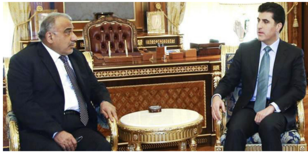
البارزاني في لقائه عبد المهدي

على الصعيد ذاته، أكد مسعود البارزاني رئيس إقليم كردستان، أن بغداد ستسردل إلى أربيل مبلغ 500 مليون دولار كجزء من الاتفاق الذي تم التوصل إليه بين الجانبين الأسبوع الماضي.