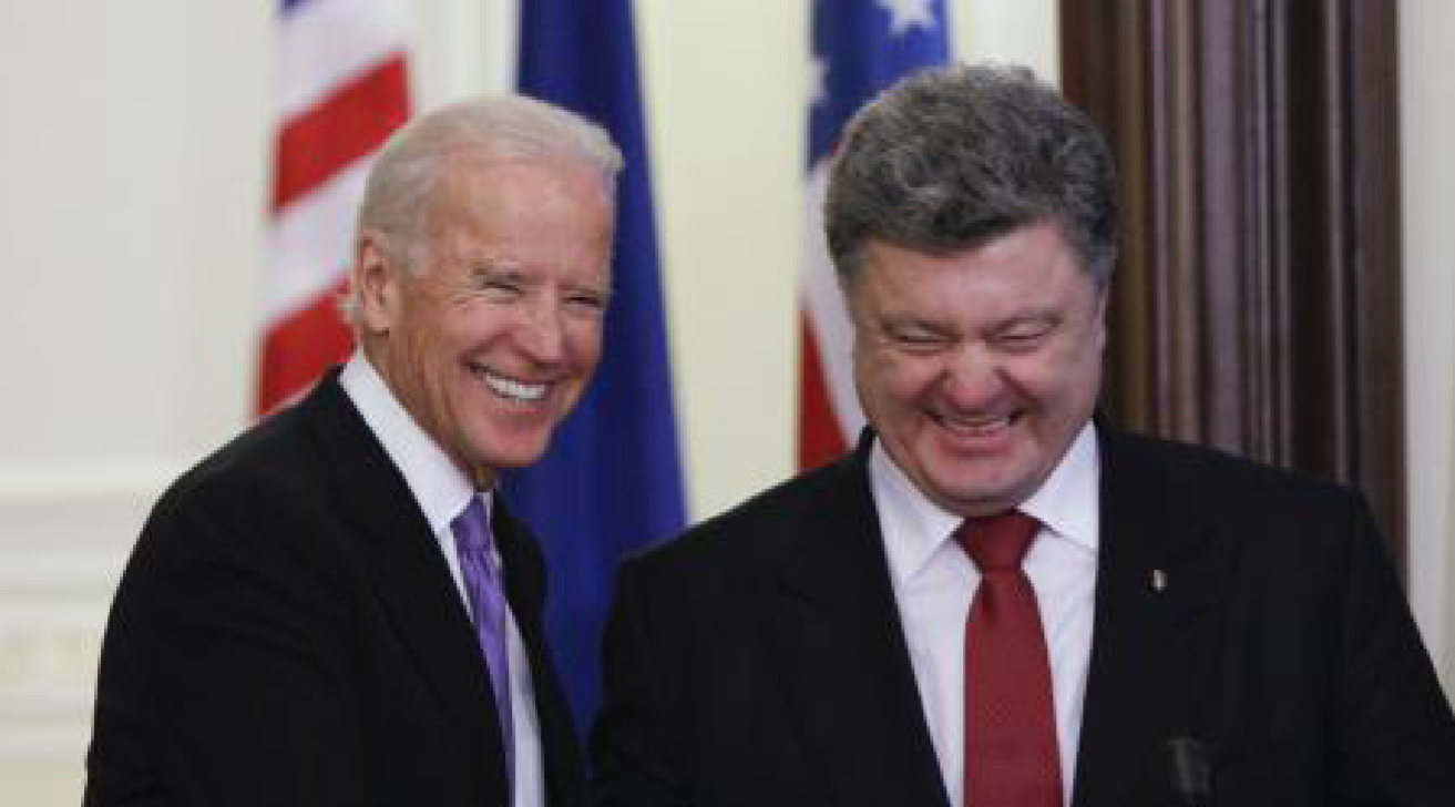
بوروشينكو وبايدن يوم أمس في كييف

إلى جانب بوروشينكو إن سلوك روسيا "انتهاك للمبادئ الأساسية للنظام الدولي". وتابع بايدن أن الولايات المتحدة ستدعم دائما النهج الديمقراطي الإصلاحي في أوكرانيا لكنه لم يشير إلى أي مساعادات جديدة. وقال بيان صدر عن مكتب بايدن إنه لن يوافق الكونجرس فإن البيت الأبيض سيستعهد بتقديم 20 مليون دولار لمساندة إصلاح قطاعات إنفاذ القانون والعدالة في أوكرانيا.