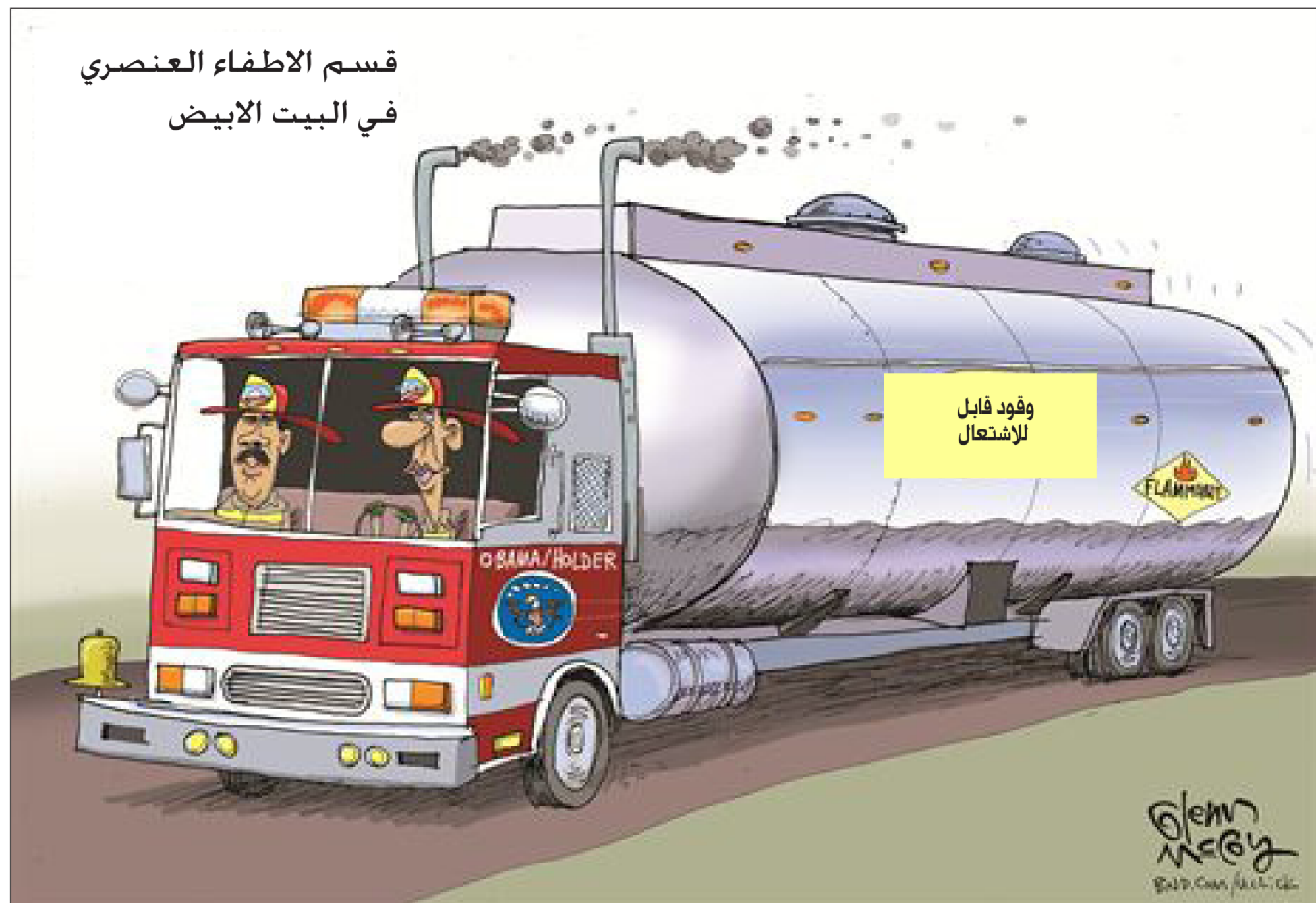
بريشة «غلين مكوي» عن موقع «تاون هول»