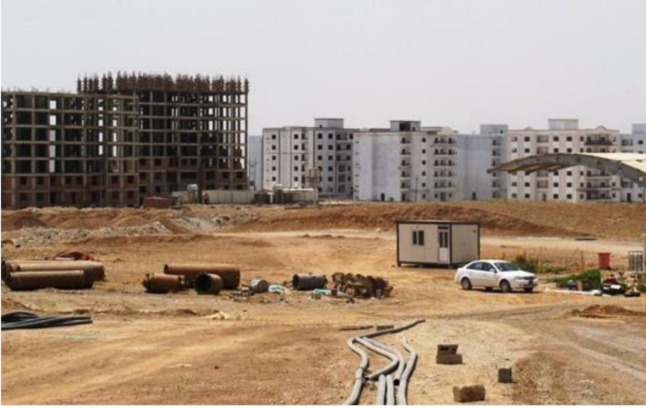
جانب من احد المشاريع «أرشيف»

مجاميع مسلحة على أغلب مناطق تلك المحافظات أحدثت هذه الأزمة إرباكاً على المستويين الشعبي والاقتصادي. وتتركز في كركوك المتنوعة عرقياً مشكلات إدارية عديدة بين اربيل وبغداد وتعد من المناطق المتنازع عليها التي لم يمت بيت في أمرها حتى الآن. ويحتاج كركوك الغنية بالنفط وغير المستقرة أمنياً إلى استثمارات في مجال الطاقة والوقود، وبحسب مراقبين فان التوترات السياسية فيها قوض إلى حد كبير من النشاط الاستثماري.