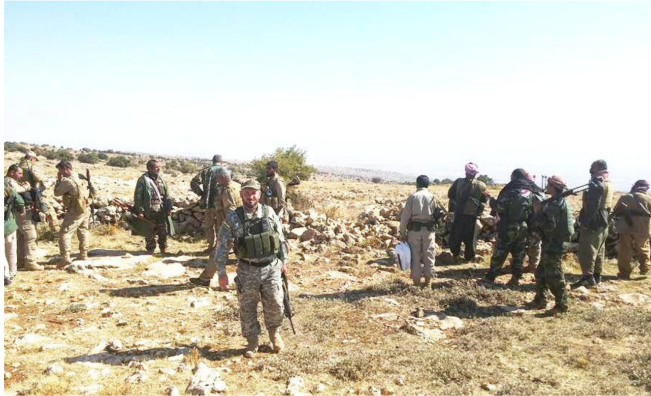
مقاتلو جبل سنجار

ضابط كردي: التقدم الأخير لقوات البيشمركة في الجانب الغربي من