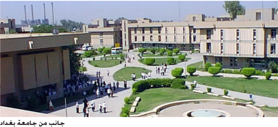
جانب من جامعة بغداد