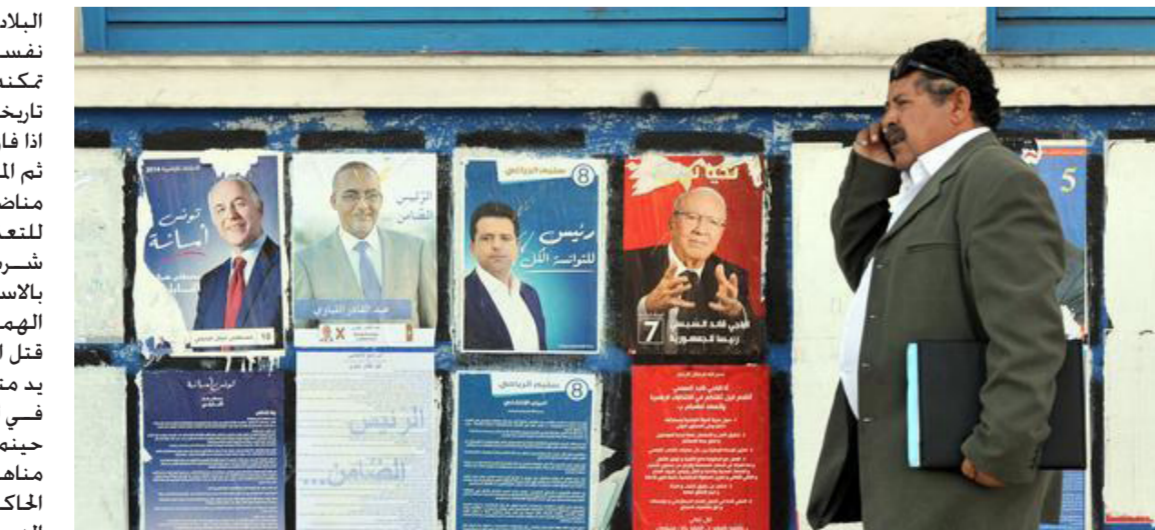
مشهد من الشارع التونسي خلال حملات الدعاية الانتخابية

الهمامي الذي صعدت أسهمه بشكل كبير بريد الاستفادة من المصادقية والتعاطف اللذين حظى بهما الجبهة الشعبية التي حصلت على 16 مقعدا في البرلمان.