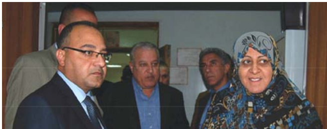
الدكتورة عديلة حمود

الحوال الناجعة والفورية لها للوصول الى رضا المستفيدين من الخدمات الصحية وجعلها مواكبة