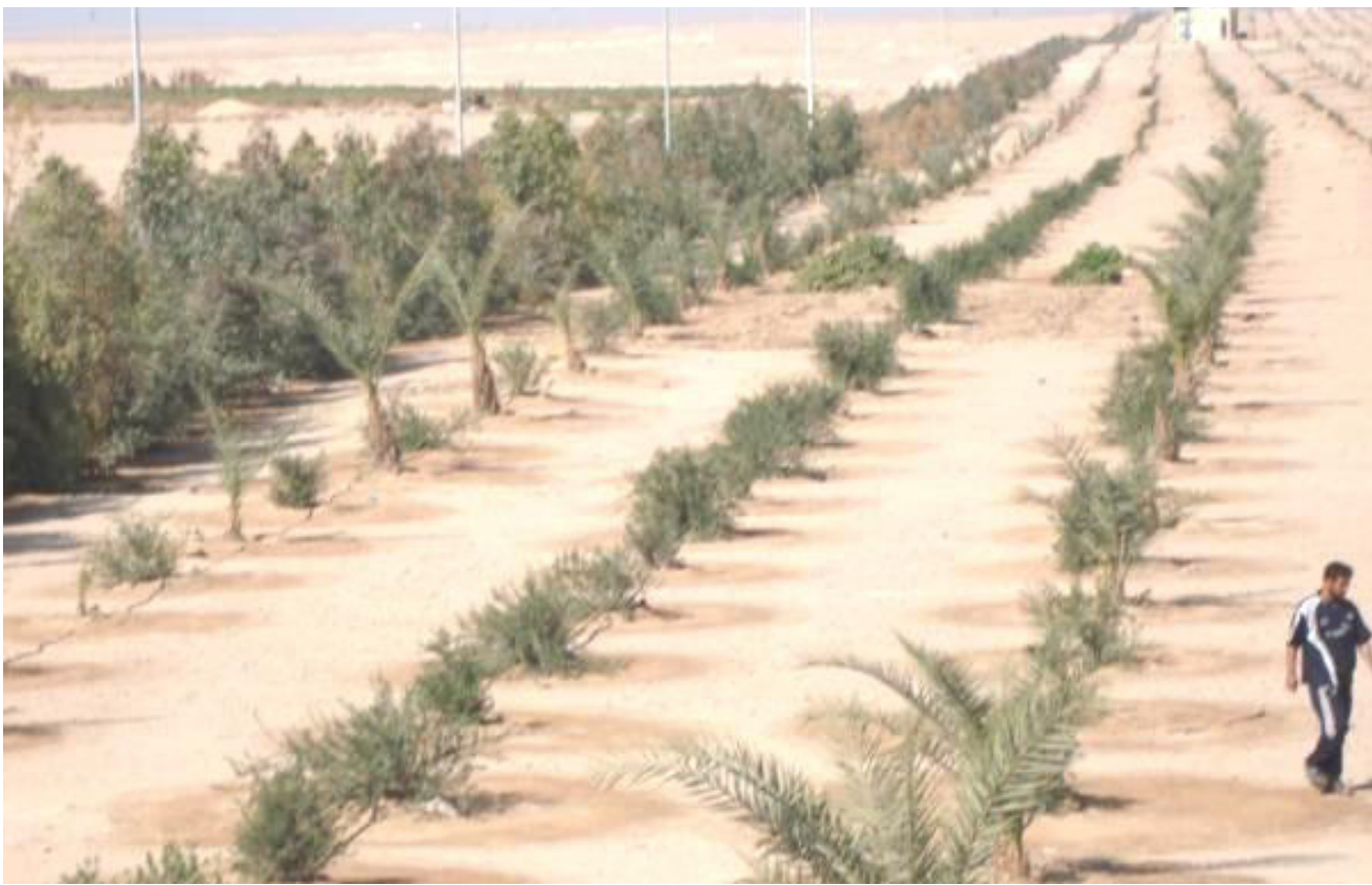
جانب من مشروع الحزام الاخضر

الخفيفة أما معمل إصلاح المولدات فقد قام بإصلاح (53) مولدة عاطلة أعيدت للعمل في الأقسام المختصة. وبيّنت «أن معمل إصلاح الغواطس والمحركات تسلم (17) غاطساً تم إصلاح (11) منها أعيدت للعمل في محطات الجاري والتبقي(6) في طريقها للإجازة فيما قامت ورش الإدامة بإجراء الصيانة الدورية لـ(3193) سيارة وآلية للمحافظة عليها وبمهمة عملها بصورة صحيحة ومن دون توقف» .