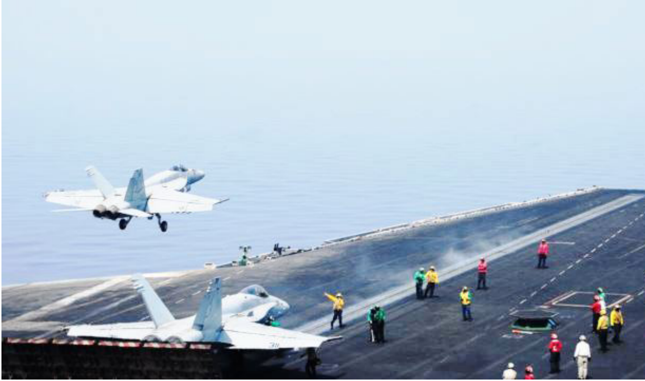
حمالة الطائرات الأميركية

تسريبات عن استعدادات مكثفة لقوات البيشمركة في محور سهل نينوى. ويقطن سهل نينوى خليط قومي وديني ومذهبي متنوع. ويضم الكرد والعرب والتركمان والشبك (من السنة والشيعه) فضلا عن الايزيدية والمسيحيين والكاكانيين وغيرهم. وكان تنظيم داعش قد بسط سيطرته على معظم اجزاء بلدات وعلى سهل نينوى في السادس من شهر آب الماضي. بعد ان نجح في بسط سيطرته على مركز مدينة الموصل ومناطق مجاورة لها في العاشر من حزيران الماضي.