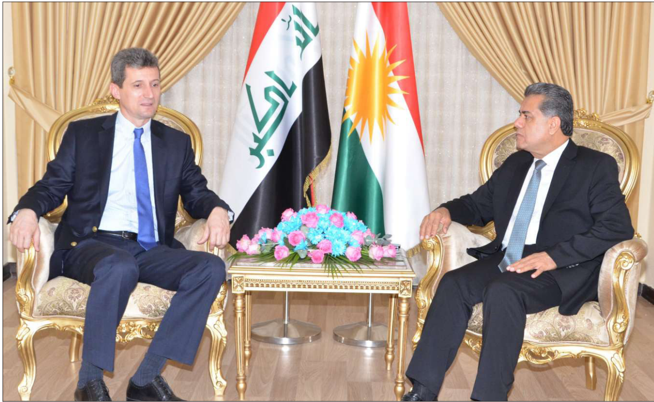
لقاء حكومة الإقليم برئيس بعثة الأمم المتحدة "أرشيف"