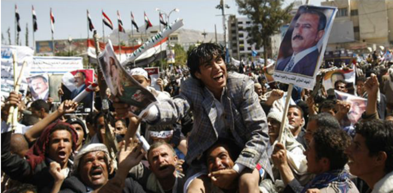
تظاهرات الحوثيين وأنصار حزب المؤتمر الشعبي الذي يتزعمه الرئيس السابق علي عبدالله صالح

تهدف إلى اخراج البلد من أزمة سياسية خطيرة، وتاخر تشكيل الحكومة المقررة في اتفاق السلام الموقع في 21 أيلول يوم سيطرة المتمردين الحوثيين على صنعاء. بسبب الخلاف بين حركة التمرد وخصومها السياسيين. ورحبت واشنطن بتشكيل الحكومة مؤكدة أنها تشجع اليمن على تجاوز الخلافات بين الأحزاب بعد الأزمة المستمرة منذ أسابيع. وقالت الناطقة باسم مجلس الأمن القومي برناديت ميهان في بيان أن واشنطن «ترحب بتشكيل حكومة جديدة في اليمن».