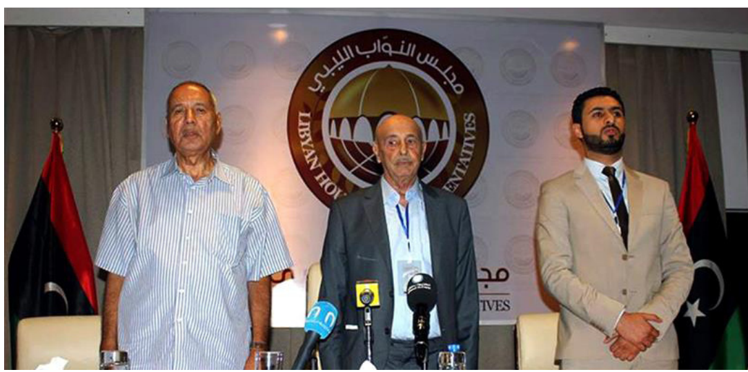
رئيس مجلس النواب الليبي عقيلة صالح عيسى

مقدشو - وكالات: استعادت حركة الشباب الإسلامية في الصومال، أمس السبت، سيطرتها على جزيرة استراتيجية جنوبي البلاد كانت تقع في قبضة القوات الموالية للحكومة الأخادية، والتي ردت بنصف المنطقة. وقال شهود عيان إن ما لا يقل عن 20 شخصا قتلوا في القتال العنيف الذي وقع بعدما هاجمت حركة الشباب إقليم الصومالية جزيرة «كودة» الاستراتيجية صباح السبت. كانت تقع من الجنوب