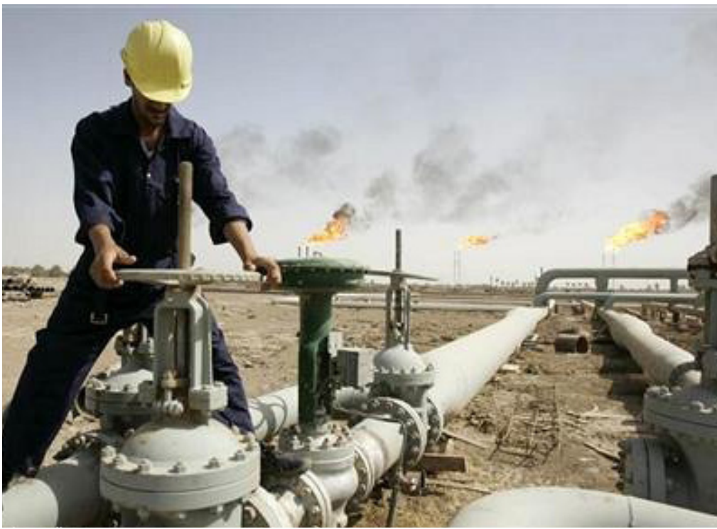
أحد الحقول النفطية في العراق

وإذ انخفض أسعار النفط ما بين 80 و85 دولاراً للبرميل الواحد في موازنة العراق للعام الحالي 2014 والذي قدر فيها سعر النفط بـ90 دولاراً للبرميل الواحد. وارتفعت أسعار النفط بداية العام الحالي والمضي الى أكثر من 110 دولار للبرميل الواحد. بحسب مراقبين.