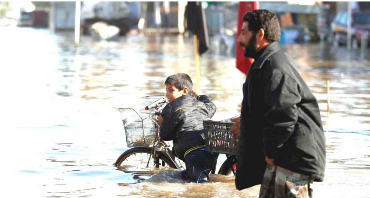
مشهد من الشتاء الماضي في بغداد

تلك المناطق . كما قامت دائرة تنفيذ كرى الانهر بارسال (8) حفارات تسليك في فناء الشرطة لغرض تصريف مياه الامطار في حال حدوث فيضان اضافة الى ارسال حفارة واحدة الى موقع جسر الكريعات العائم حسباً لأي طارئ في حال ارتفاع منسوب المياه . على صعيد متصل ترأس الوزير اجتماع اللجنة العليا للفيضان التي تضم نخبة من المستشارين والمدراء العميين لدوائر الوزارة ذوي العلاقة في موضوع الفيضان لغرض مناقشة بعض الامور المهمة والتداول بشأن تدابير الوزارة كذلك التاكيد على ضرورة توفير الحماية الامنية وكري مقدم السدود والسدات في المناطق الساخنة بعد خسدن الاوضاع الامنية فيها لغرض زيادة الاطلاقات المائية.