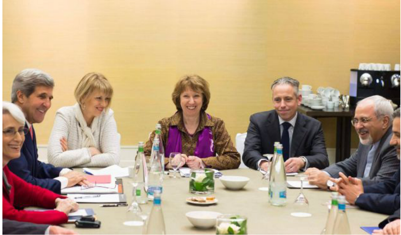
صورة من مباحثات الملف النووي الإيراني السابقة

و يجري الوكالة الدولية عمليات تفتيش منتظمة لنشأت إيران من تصدق تفسيرات ثبت أن وثائقها ومعلوماتها ليست مزيفة.