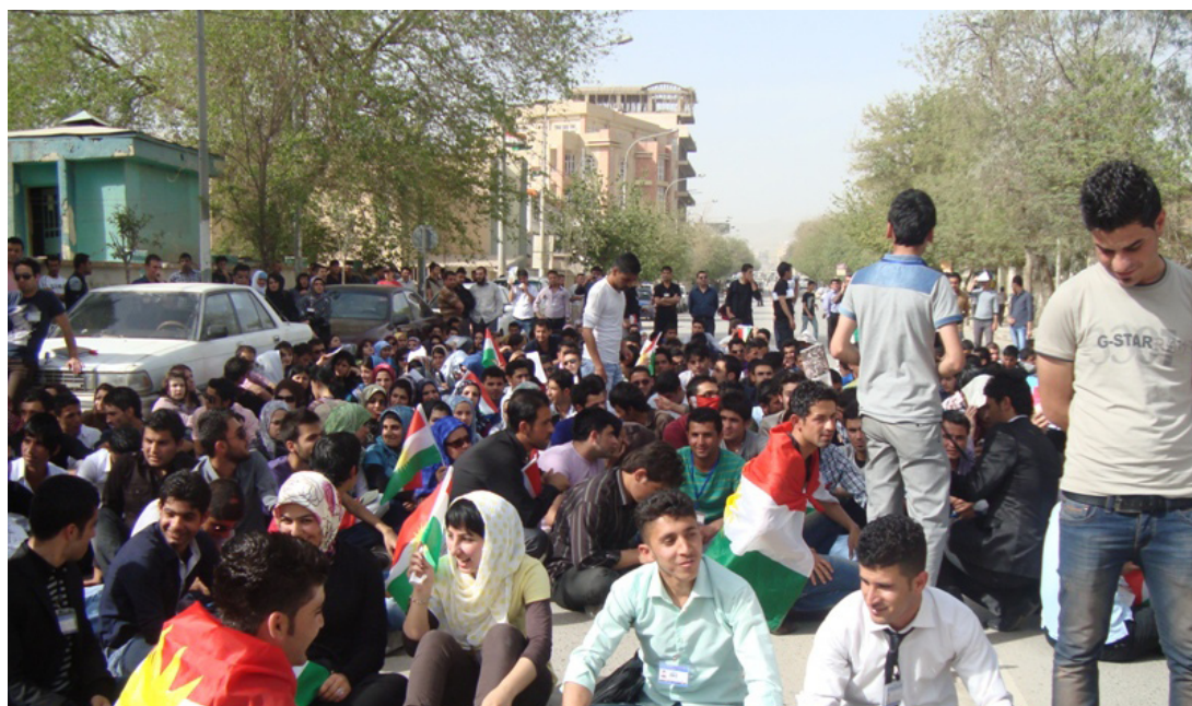
احتجاجات طلابية في السليمانية

سياقات علمية مدروسة. لكن مقاييس تؤهل خريجها ممارسة اختصاصهم مستقبلا. خاصة اذا كان هذا الاختصاص يس حياة الانسان وهو الطب». وقال طلبة وطالبات شاركوا في التظاهرة. التفت بهم «الصباح الجديد». «نعتقد ان خريجي هذه الكليات وخاصة أقسام الطب غير مؤهلين لممارسة المهنة. فضلا عن الاعداد الكبير من الخريجين الذين يشكلون عبئا على ملاكات وزارة الصحة». لافتين الى انه «على حكومة الإقليم دراسة هذا الموضوع بشكل جيد حفاظا على المستوى العلمي لخريجها». وأضافوا. ان «طلبة كلية الطب في جامعتي السليمانية وصلاح الدين في أربيل سيستمررون في الاحتجاج ومقاطعة مقاعد الدراسة الى ان تستجيب حكومة الإقليم وتعلق أقسام الطب في الكليات