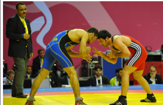
جانب من منافسات المصارعة